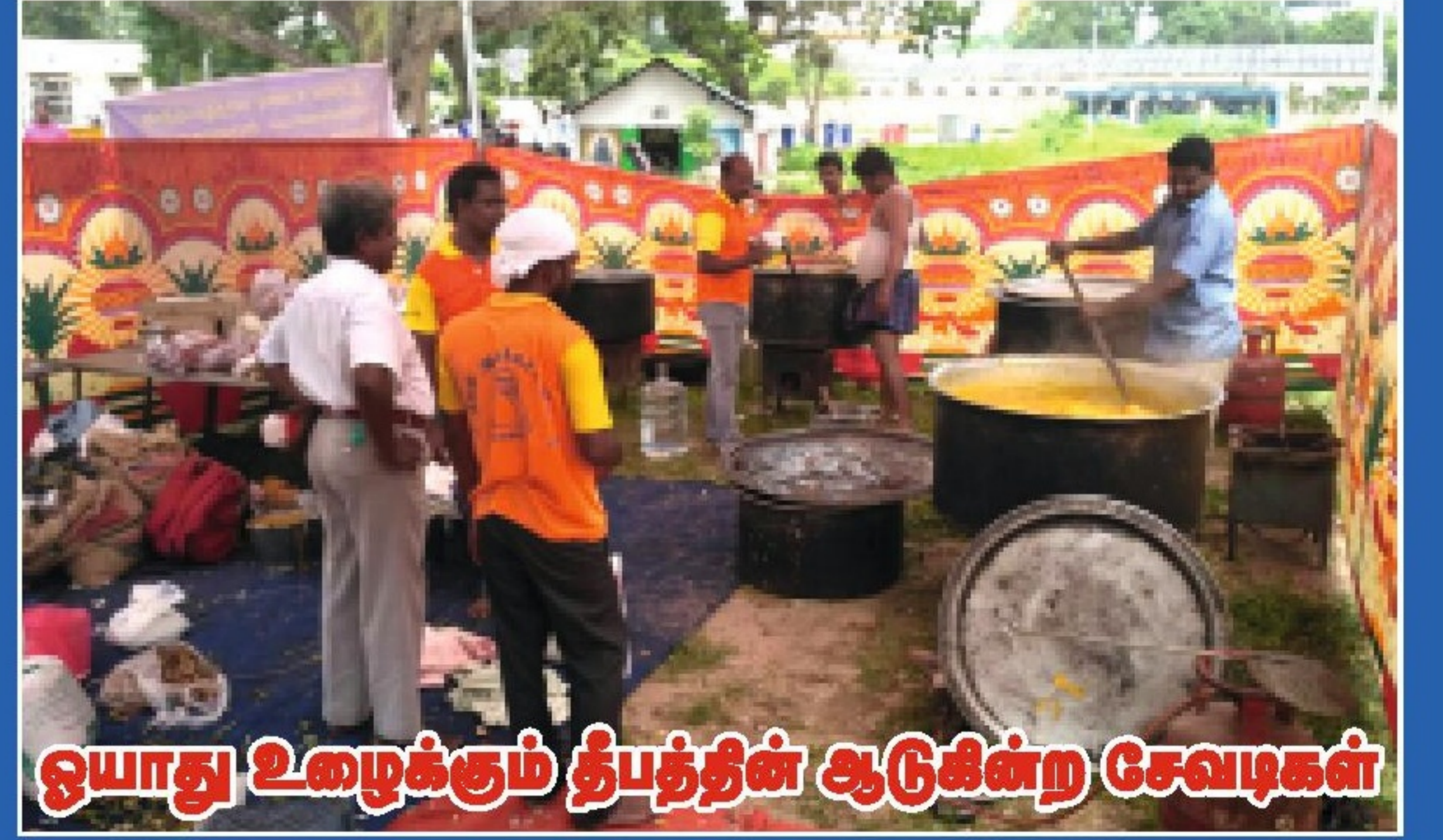
ஒயாது உழைக்கும் தீபத்தின் ஆடுகின்ற சேவடிகள்