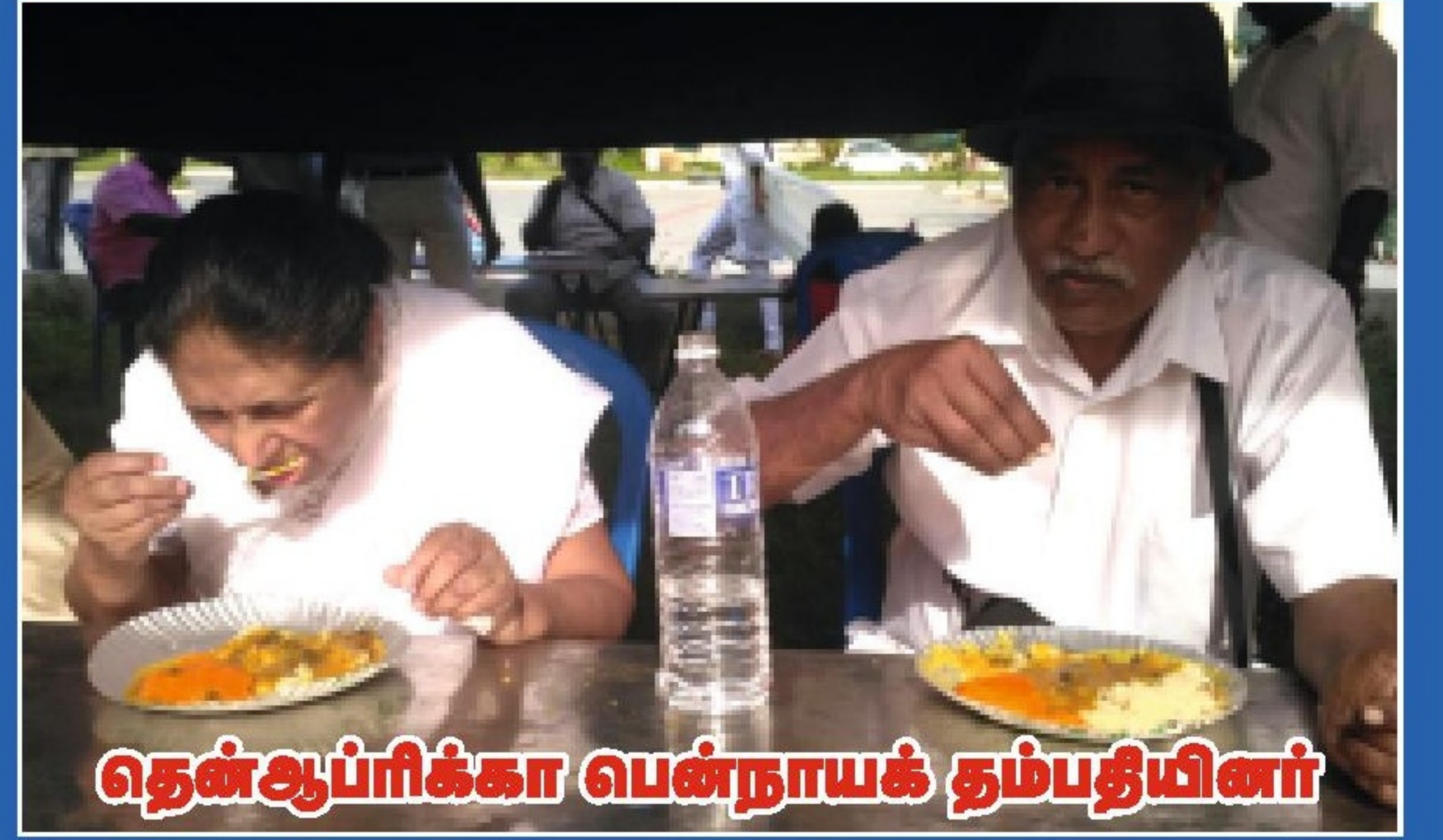
தென்ஆப்ரிக்கா பென்நாயக் தம்பதியினர்