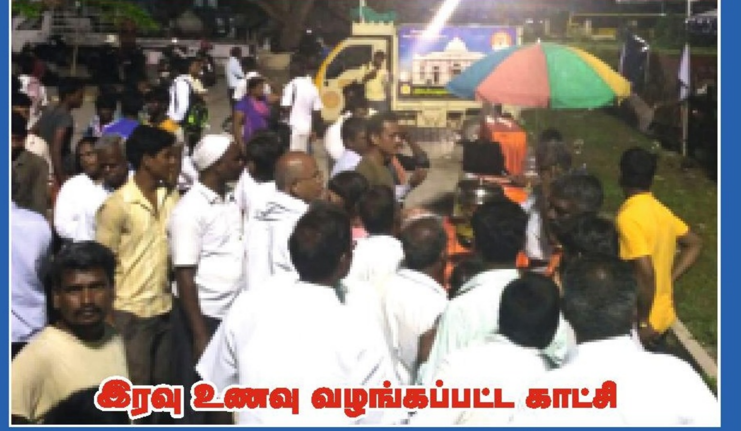
கிரவு உணவு வழங்கப்பட்ட காட்சி