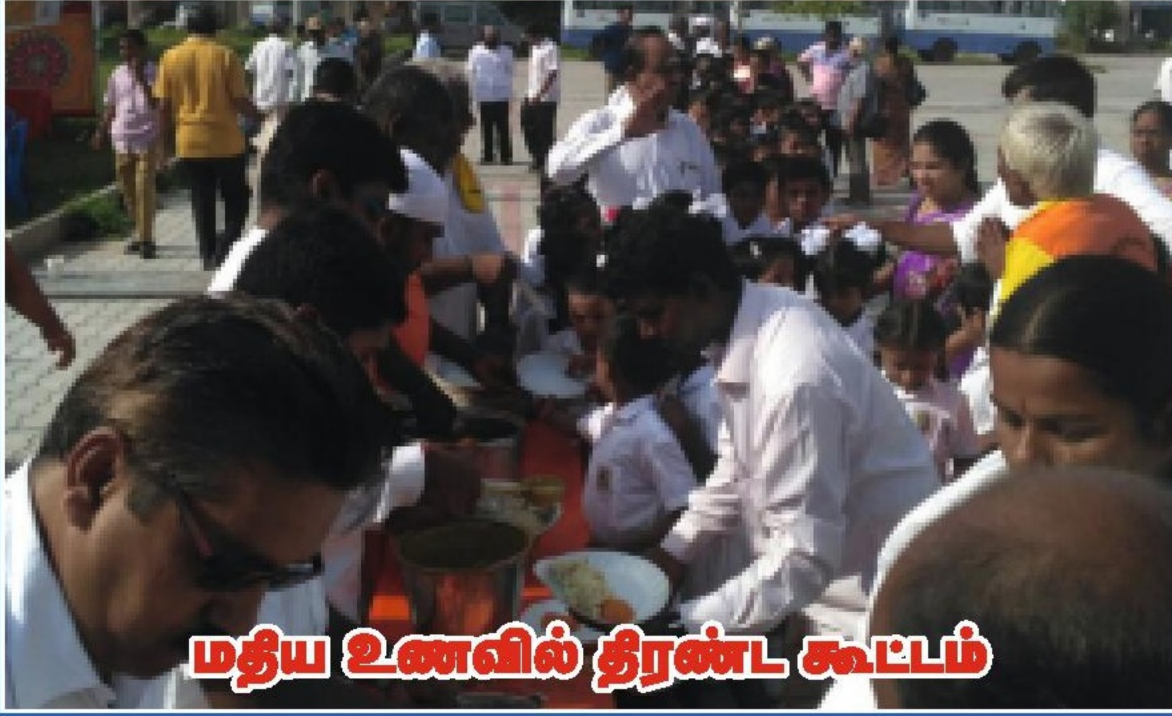
மதிய உணவில் தீரண்ட கூட்டம்