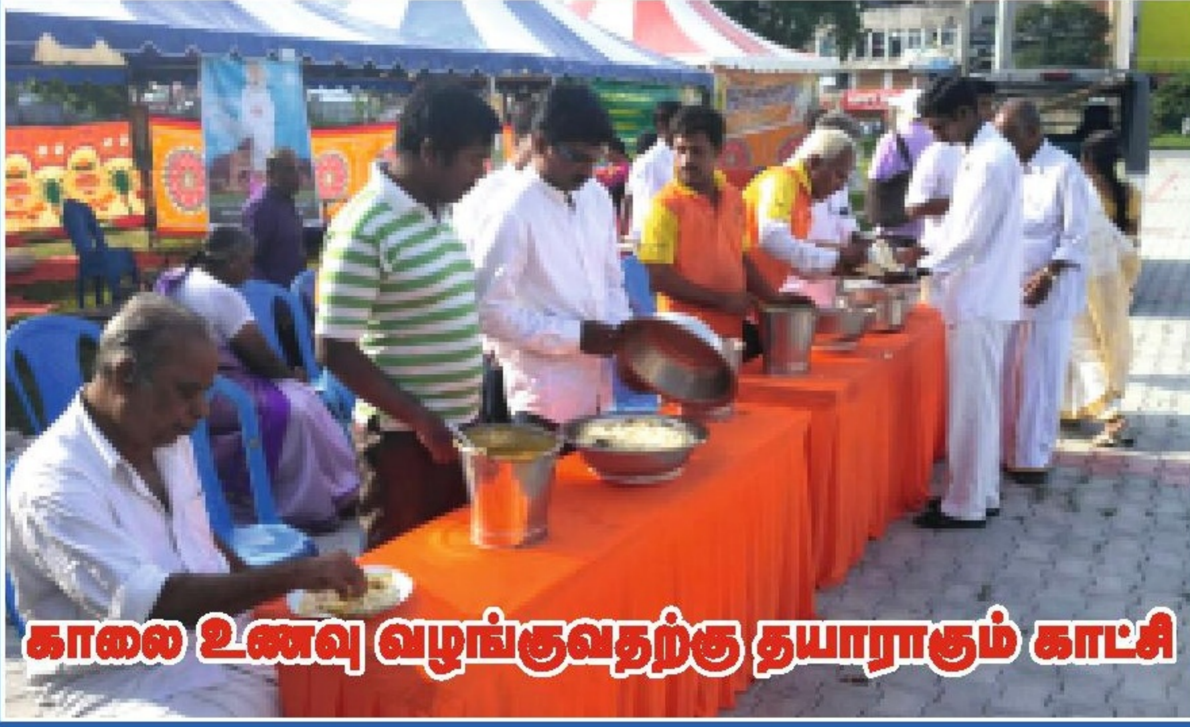
காலை உணவு வழங்குவதற்கு தயாராகும் காட்சி

சென்னை கலைவாணர் அரங்கில் நடைபெற்ற சன்மார்க்க மாநாட்டிற்கு வருகை தந்த அன்பர்களுக்கு வேளச்சேரி தீபம் அறக்கட்டளையின் சார்பில் அறுசுவை உணவு தயாரித்து வழங்கப்பட்ட காட்சி.