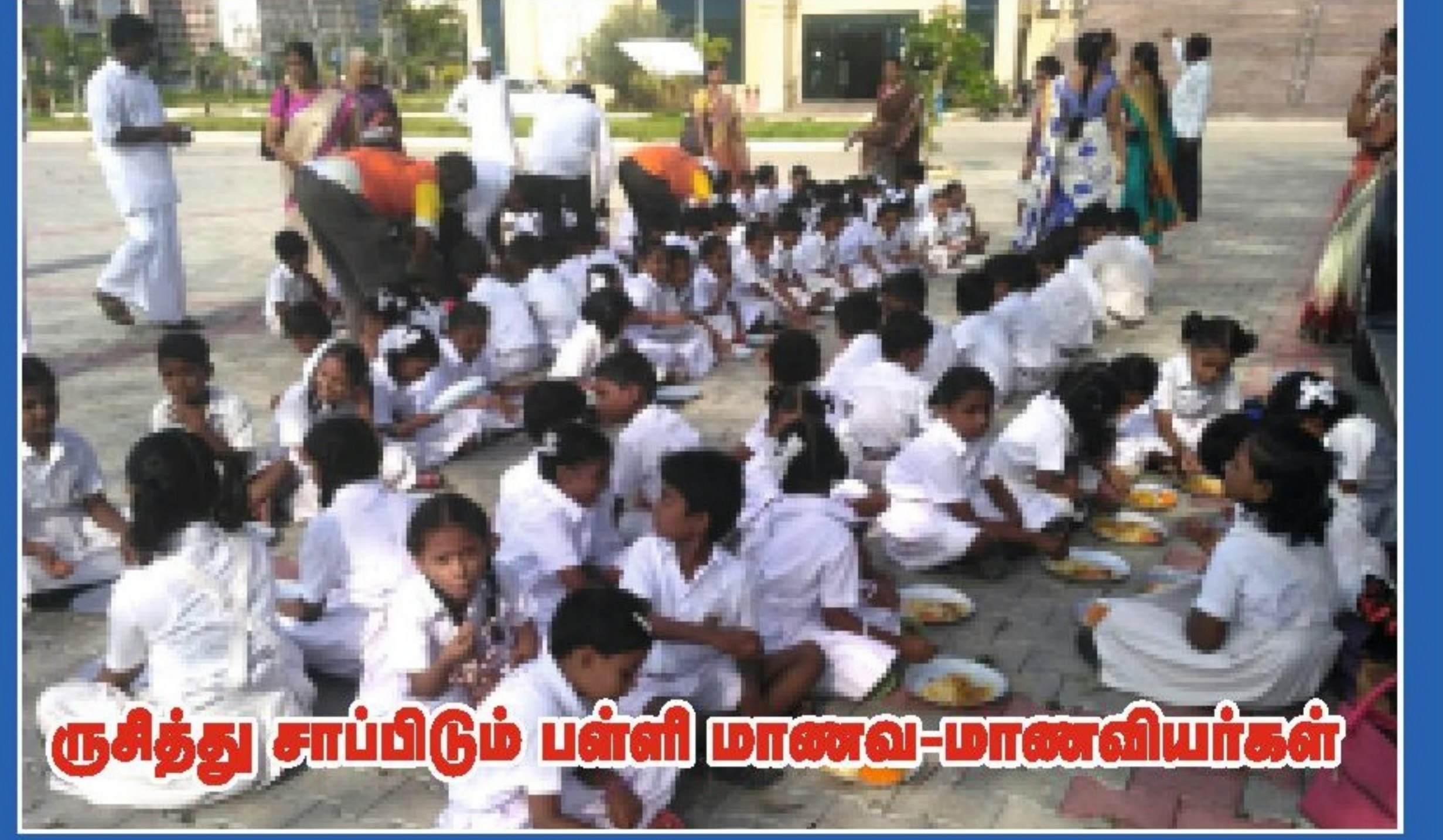
ருசித்து சாப்பிடும் பள்ளி மாணவ-மாணவியர்கள்