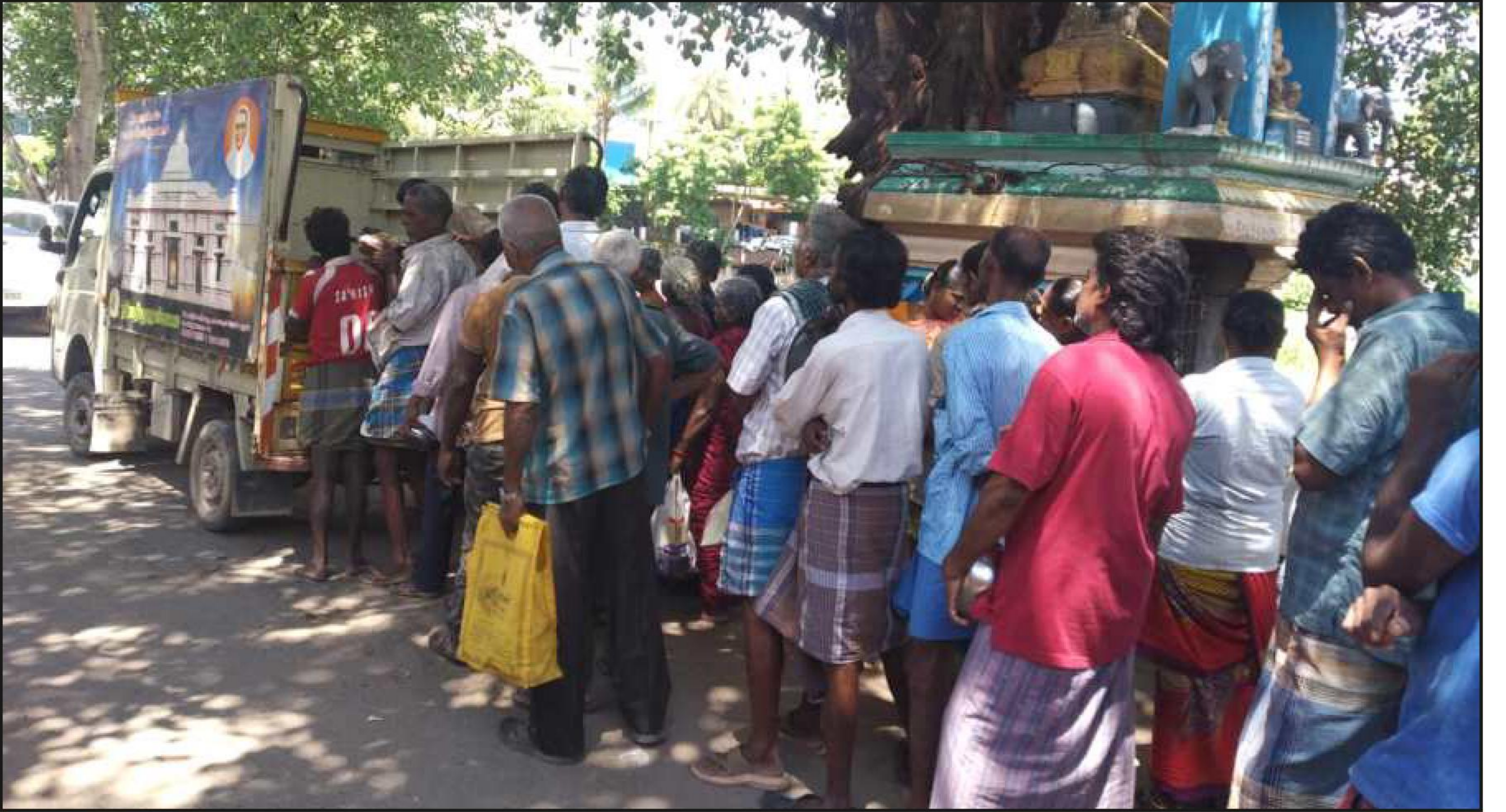
தீபம் அறக்கட்டளையின் சார்பில் நடமாடும் நித்ய அன்ன தருமச்சாலை மூலம் தினசரி பசியாற்றுவித்தல்