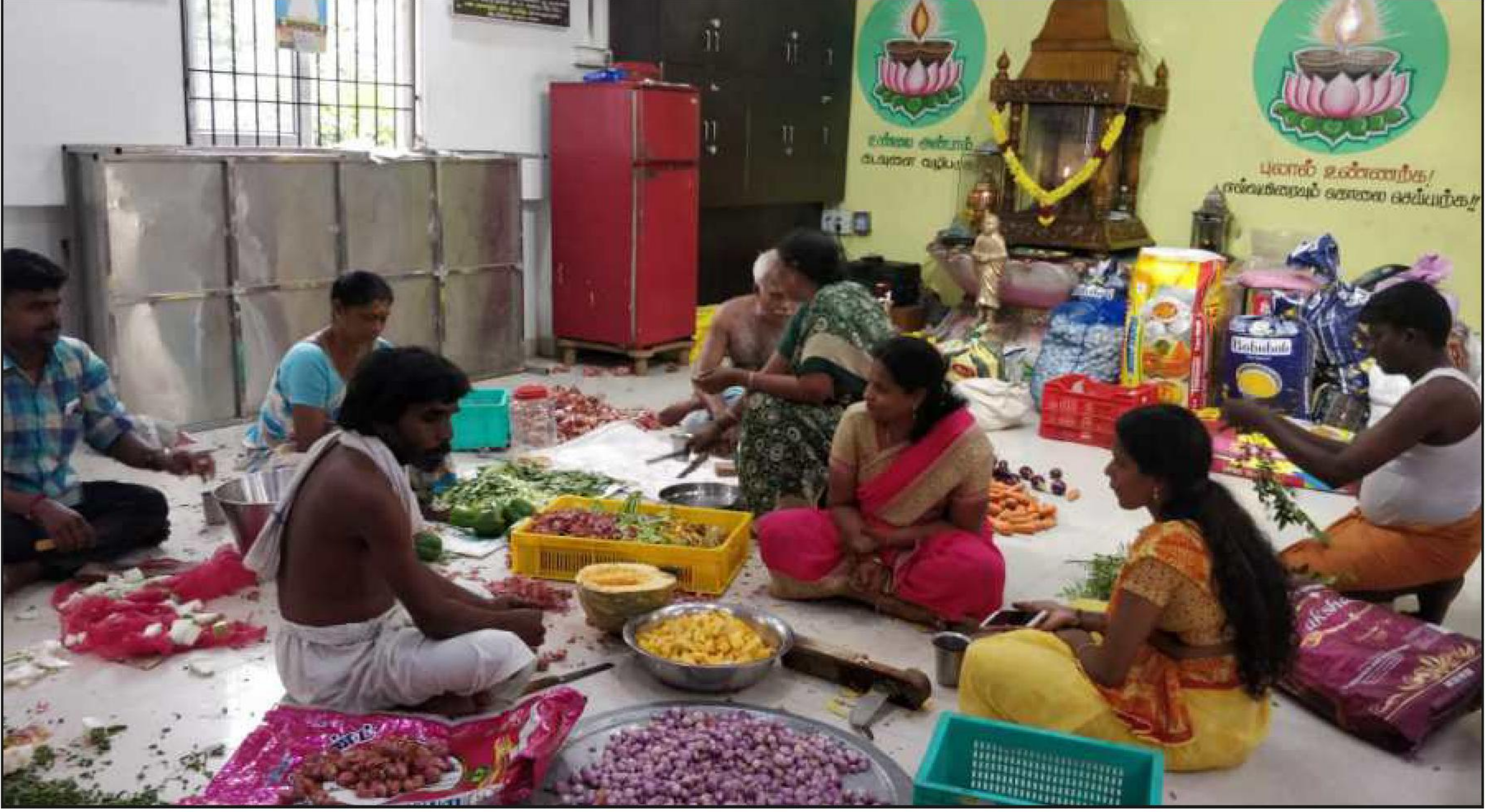
தீபம் அறக்கட்டளையின் தலைமகளும், தவம்புதல்வனும்...