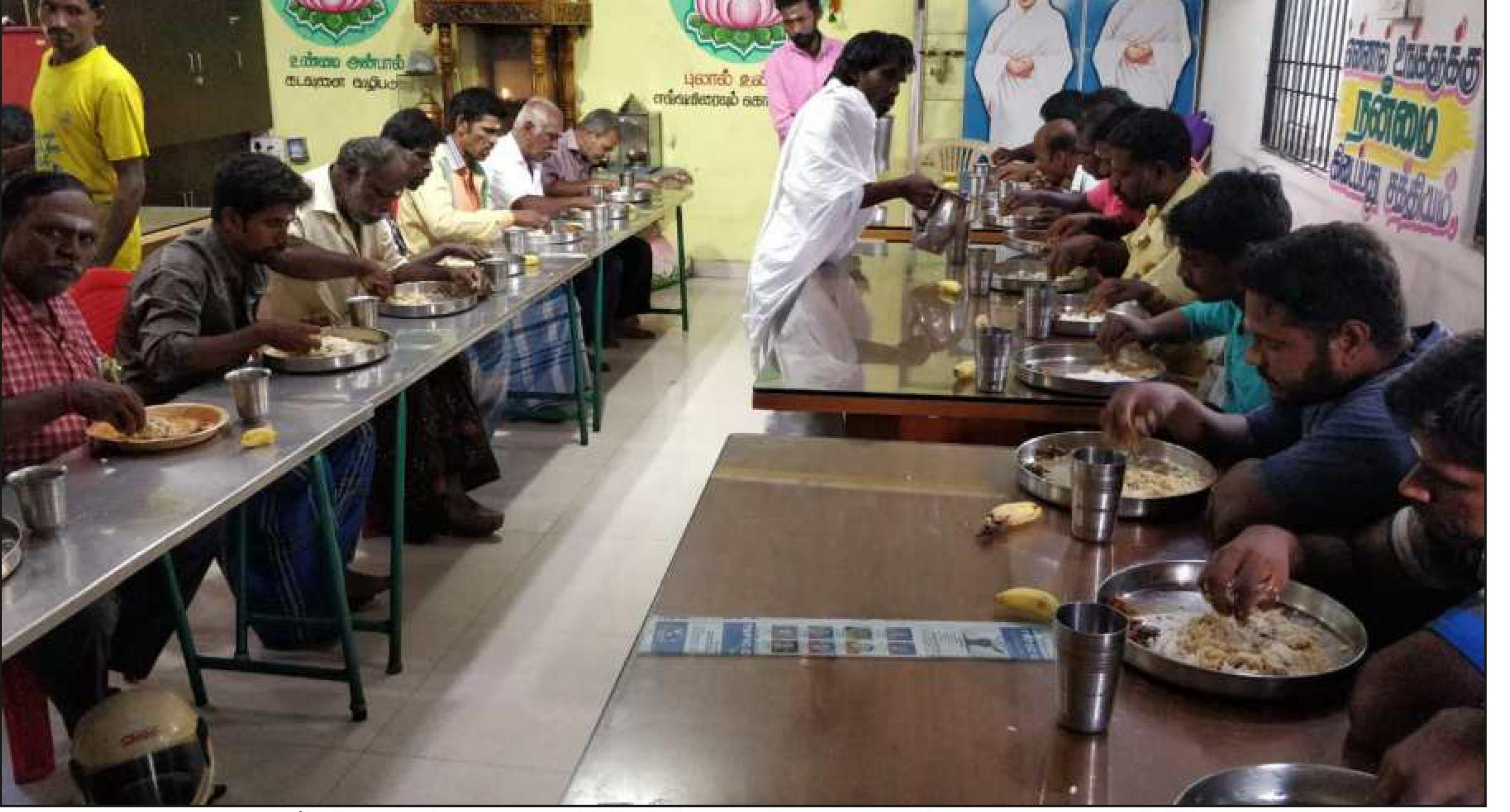
தீபம் அறக்கட்டளையின் நித்ய அன்ன தருமச்சாலை வளாகத்தில் தினசரி நூற்றுக்கணக்கானவர்களுக்கு பசியாற்றுவிக்கும் அற்புத காட்சி.