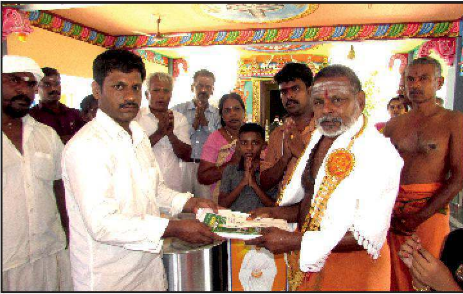
சிவானகரம் தருமச்சாலை திருவாரூர் மாவட்டம்.