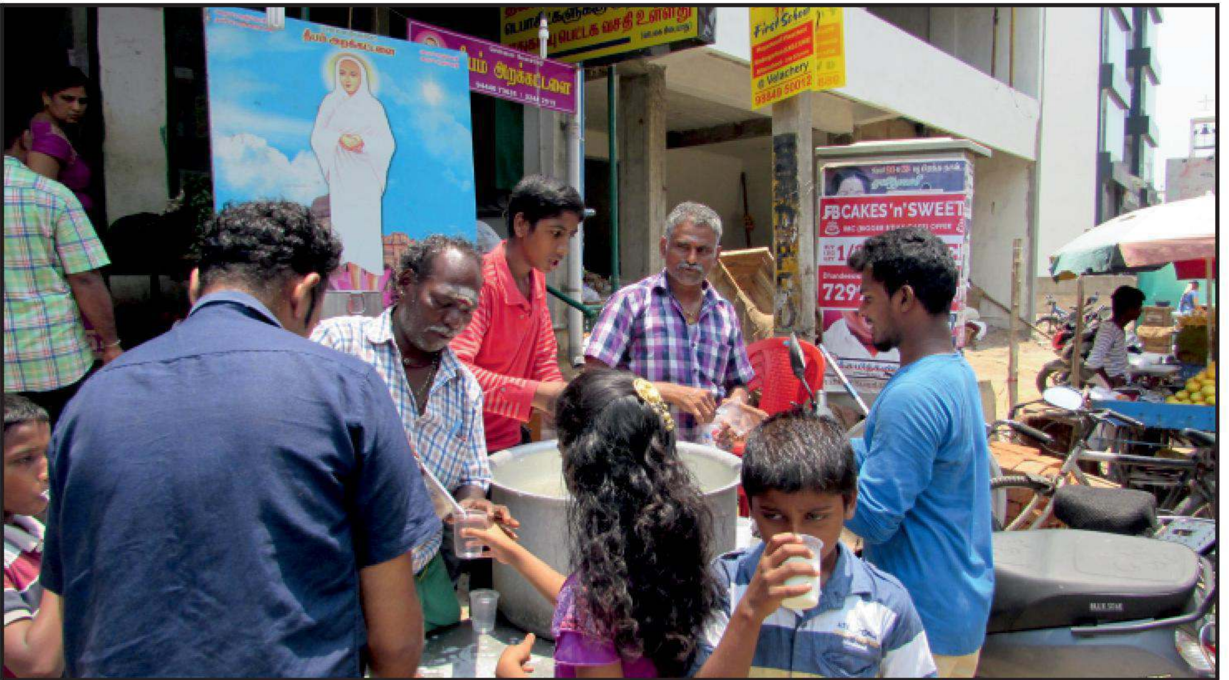
சென்னை வேளச்சேரி தீபம் அறக்கட்டளையின் சார்பில் தினந்தோறும் கோடையில் தாகம் தணிக்க நீர்மோர் வாழங்கும் சேவதாரிகள்.