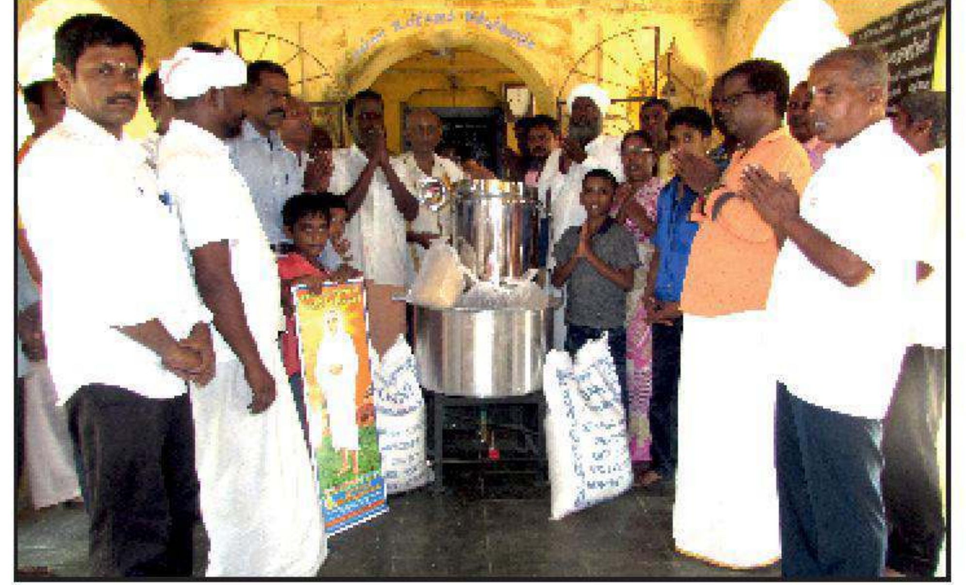
திருவீழிமிழலை தருமச்சாலை திருவாரூர் மாவட்டம்.