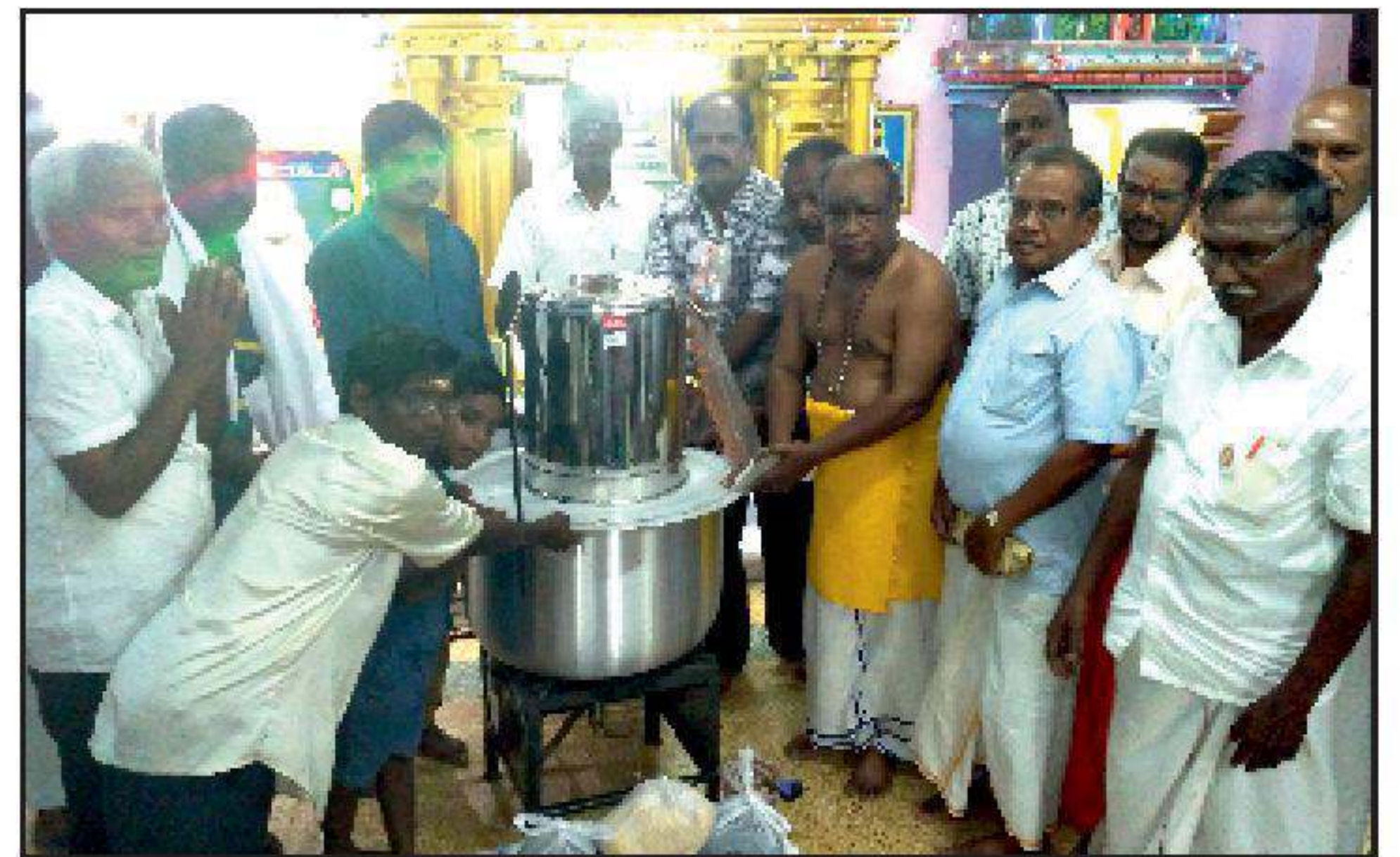
சுவாமிமலை தருமச்சாலை கும்பகோணம்.