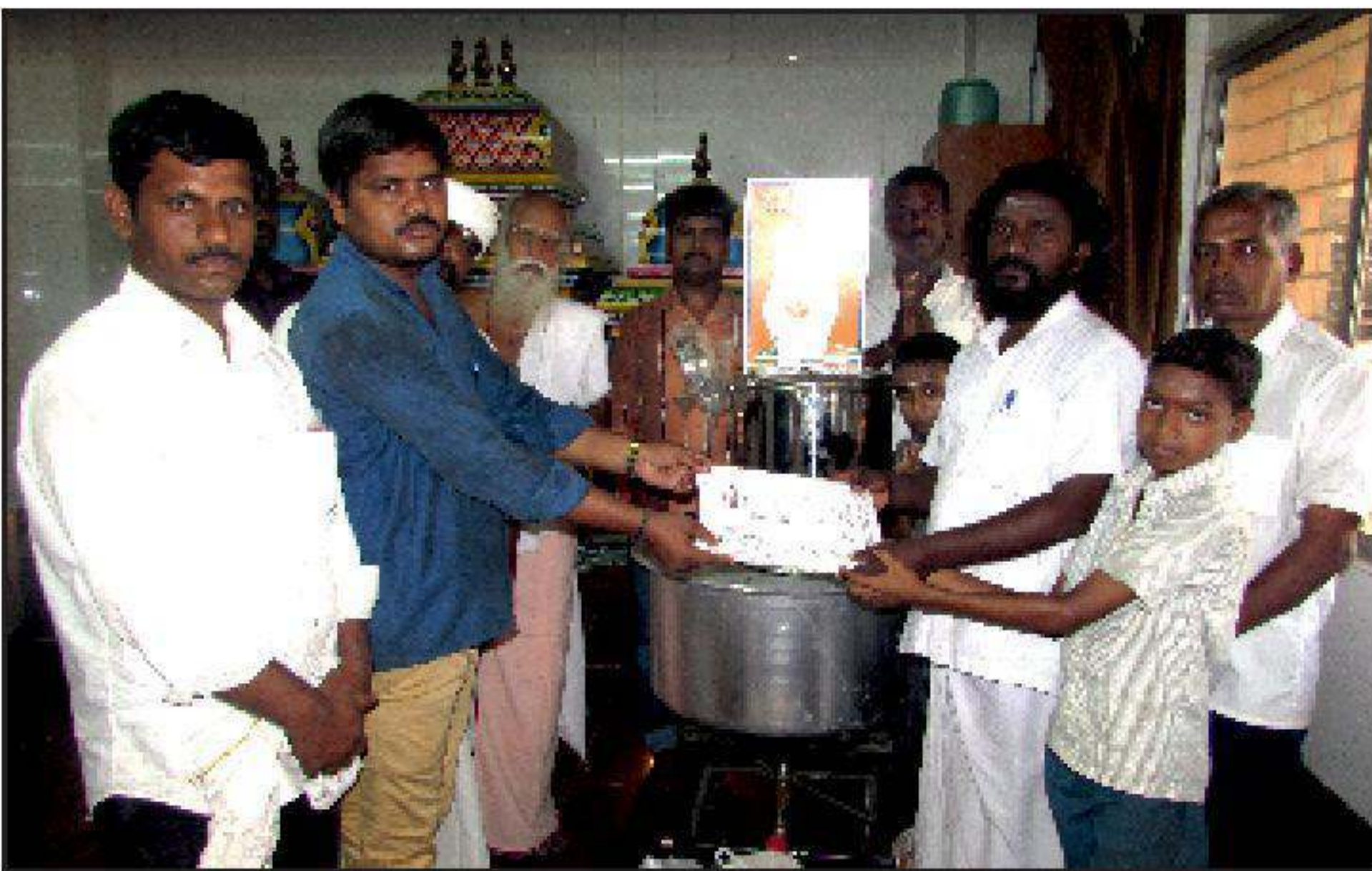
சக்கராபடித்துறை தருமச்சாலை கும்பகோணம்.