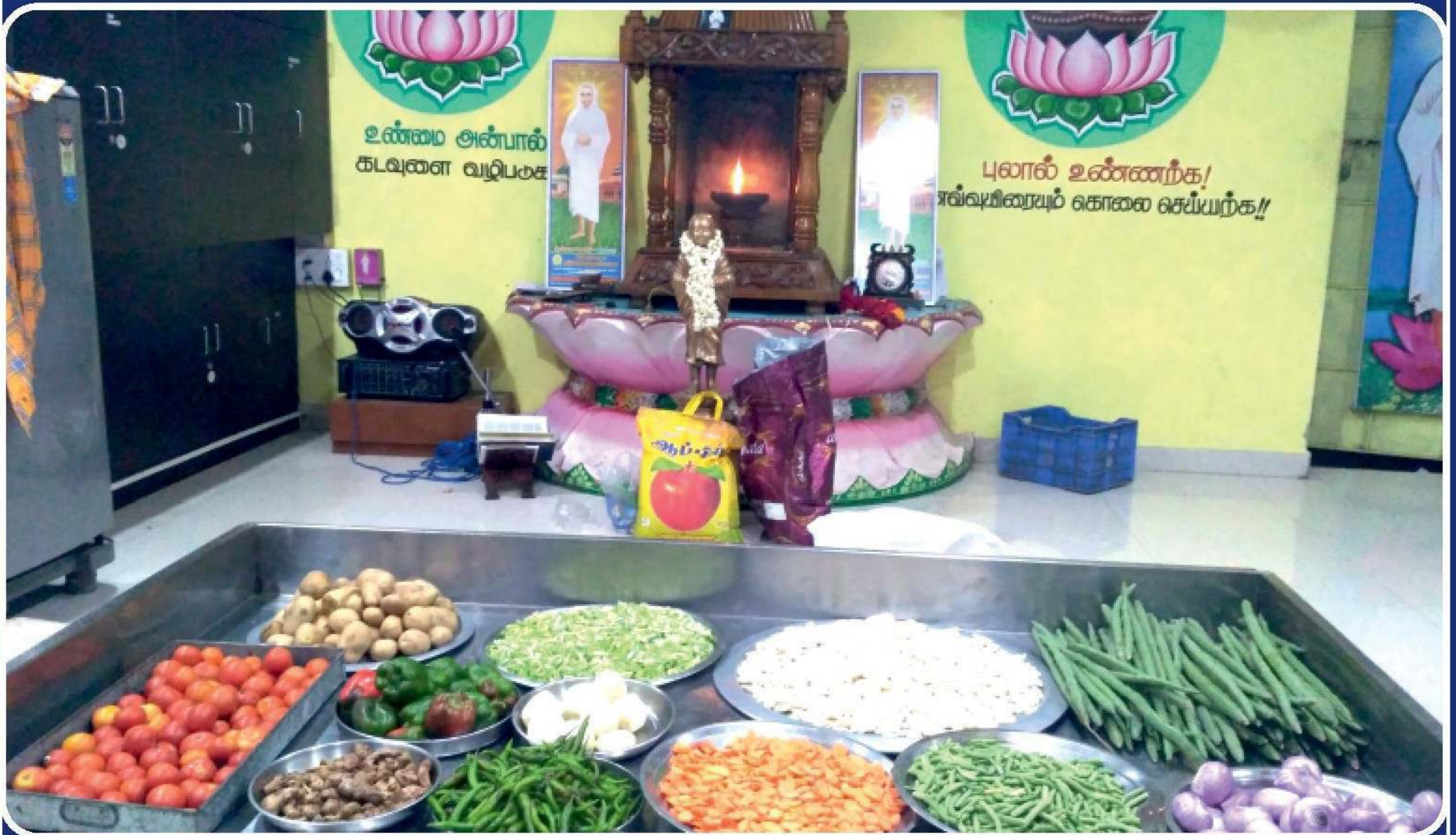
சென்னை வேளச்சேரி நீத்ய தீப தருமச்சாலையில் அருட்பொருளுகோநி ஆண்டவரி முன்பு சமைப்பதற்கு தயாராக உள்ள காய்கறி வகைகளின் கண்கொள்ளா காட்சி.