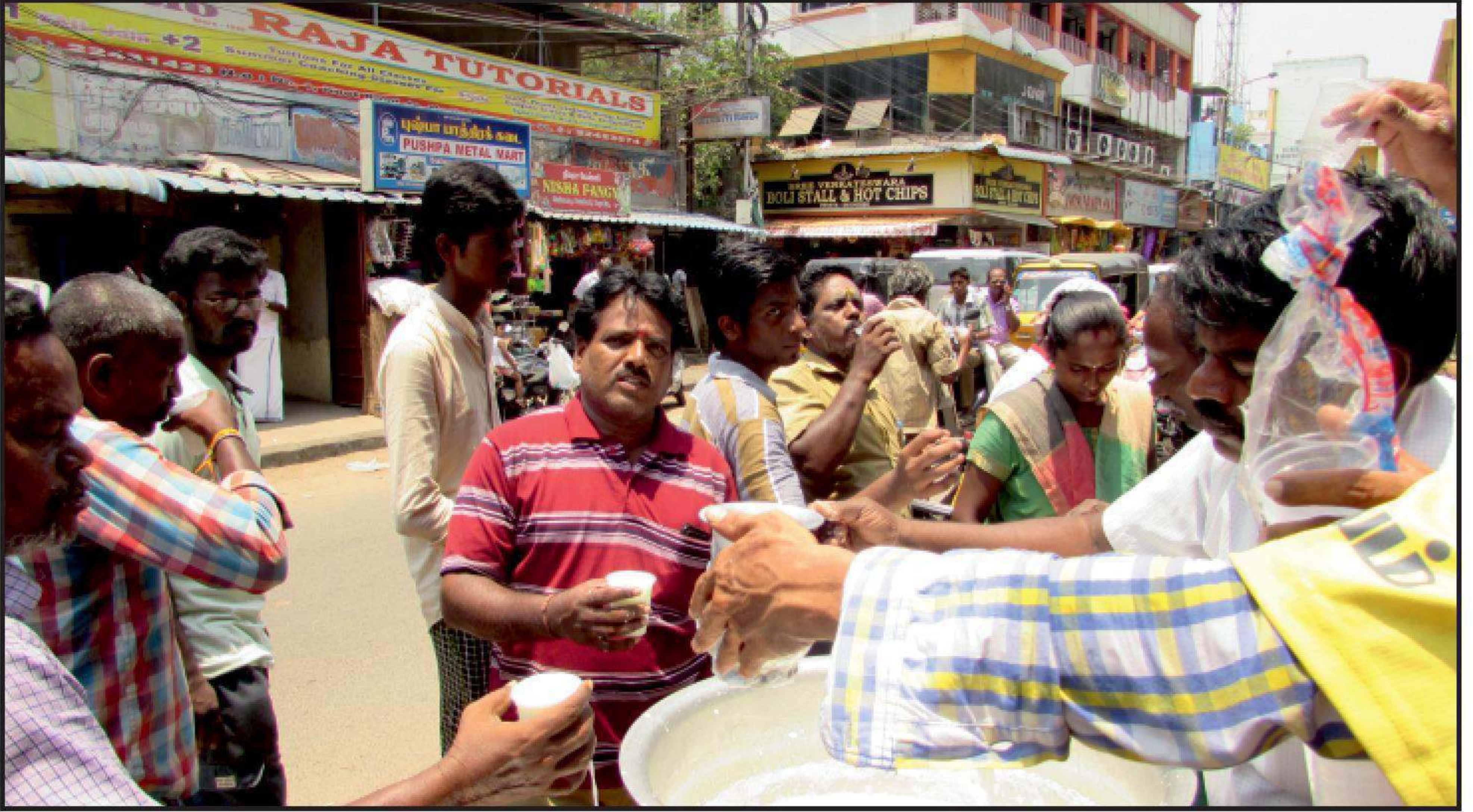
சென்னை வேளச்சேரி தீபம் அறக்கட்டளையின் சார்பில், தண்டைஸ்வரம் கோவில் வளாகம் அருகில் தினந்தோறும் கோடையில் தாகம் தணிக்க நீர் மோர்ப் பந்தல்.