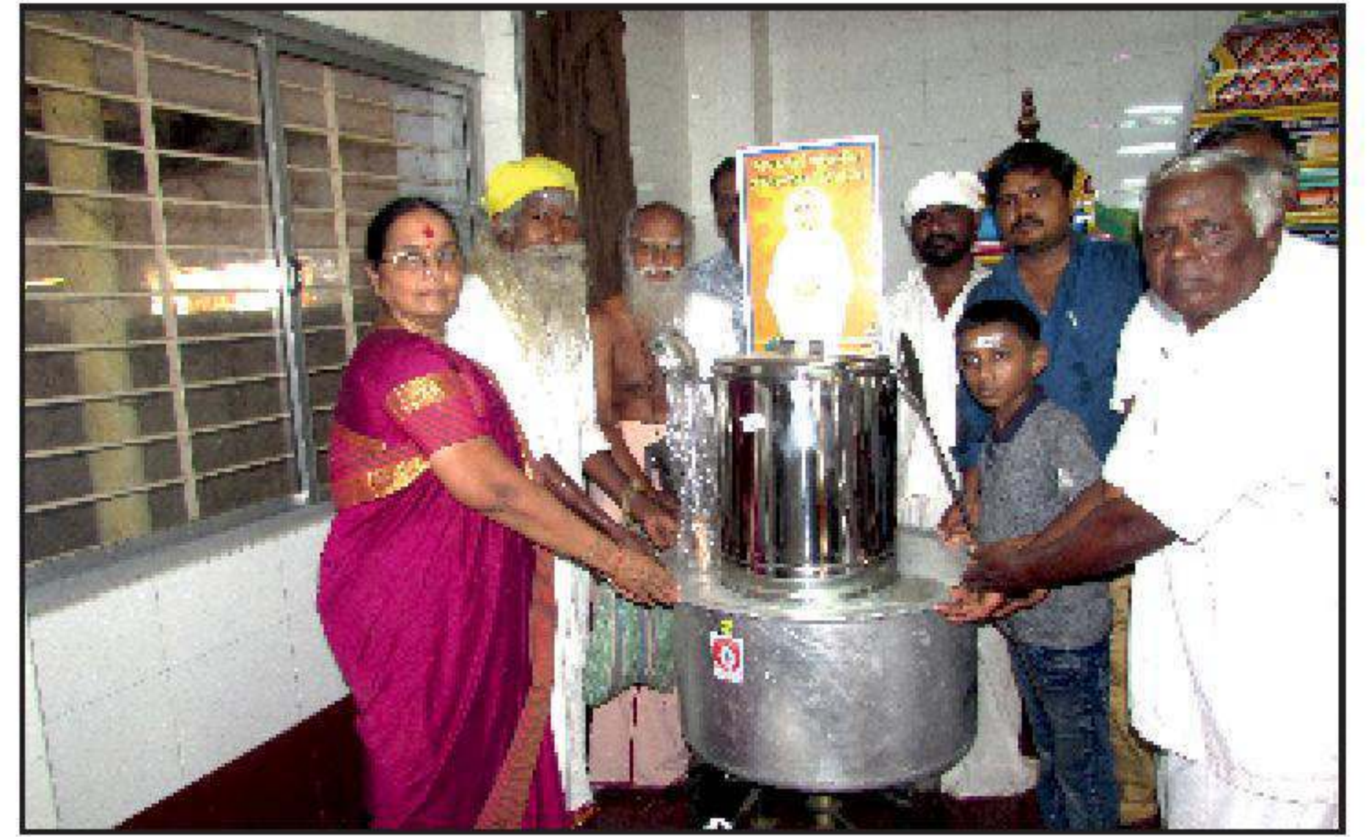
கோவிந்தகுடி தருமச்சாலை கும்பகோணம்.