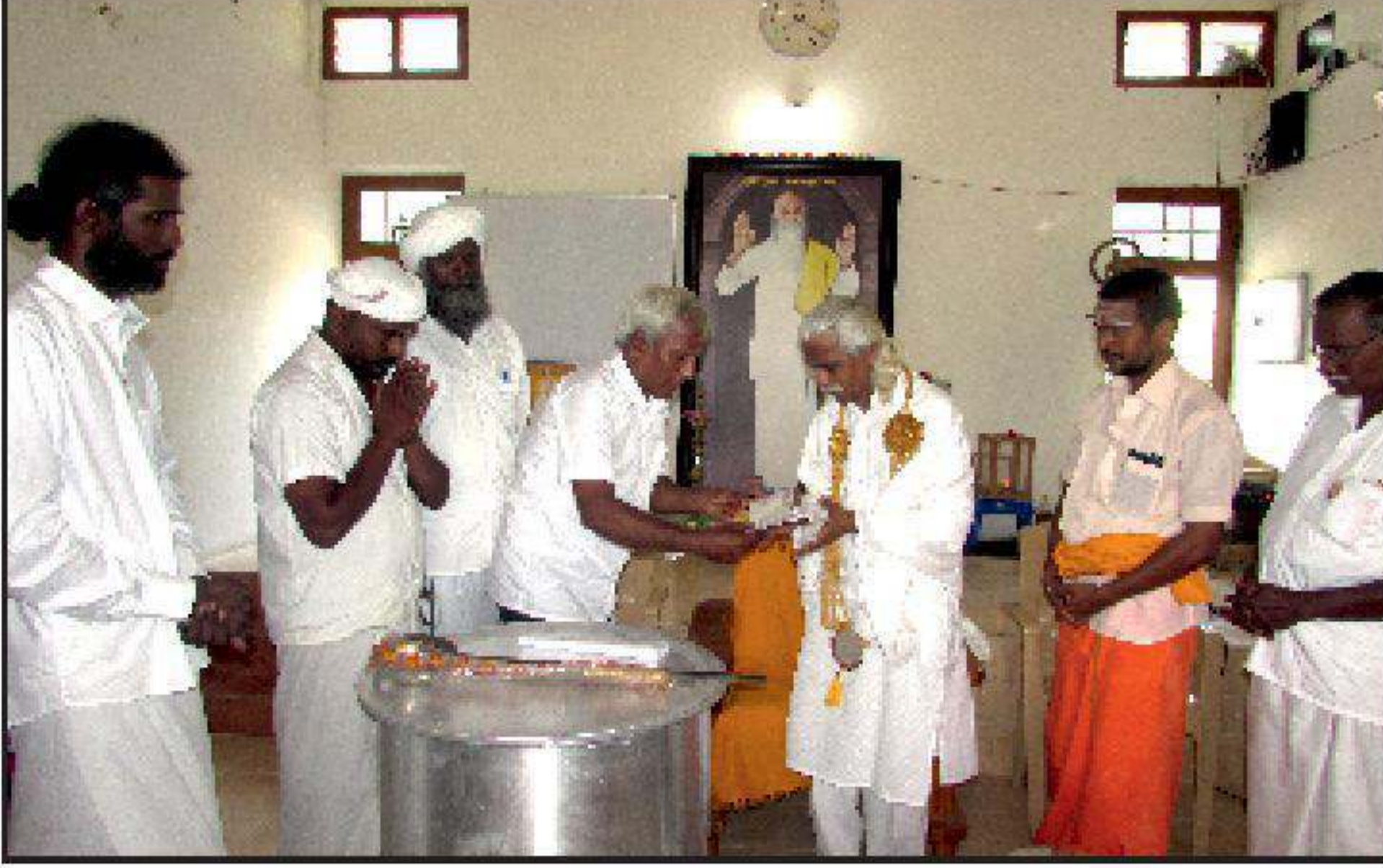
மாங்குடி தருமச்சாலை பேரளம் திருவாரூர் மாவட்டம்.