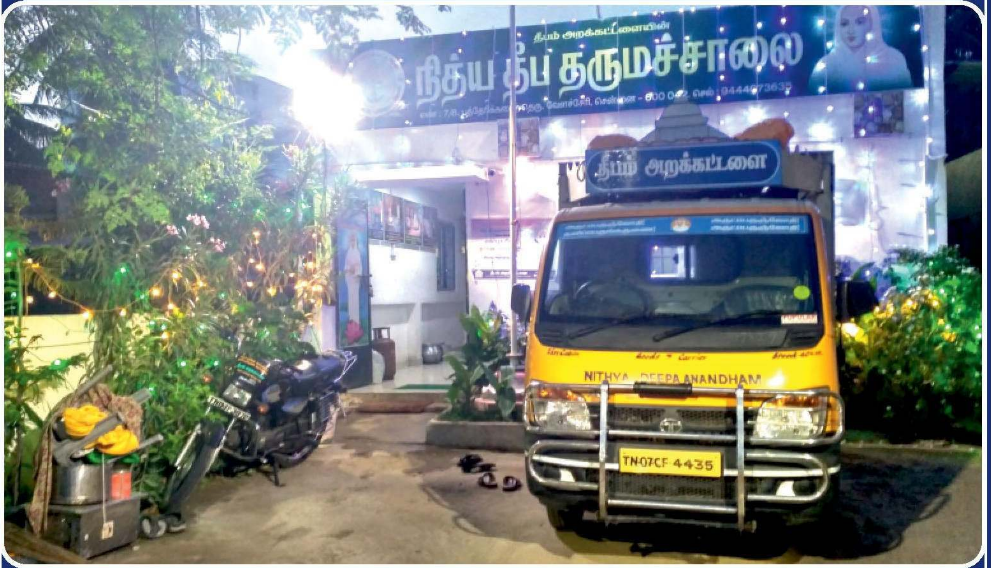
சென்னை வேளச்சேரி நீத்ய தீப தருமச்சாலை மின்னொளியில் கொலிக்கும் காட்சி.