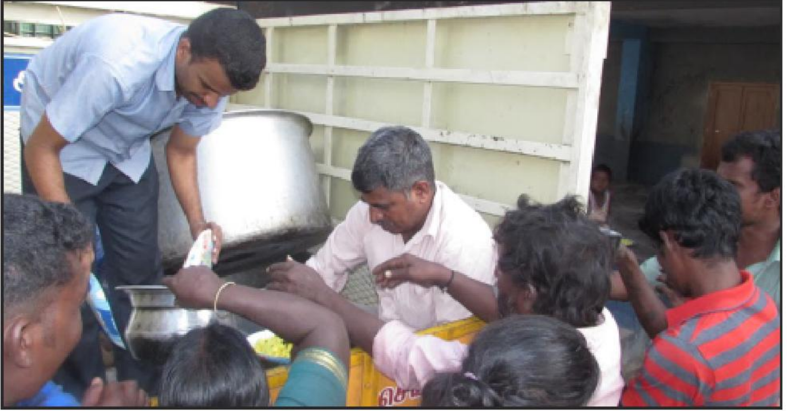
அன்னம் வேண்டும் கைகளும்; அரவணைக்கும் கைகளும்.