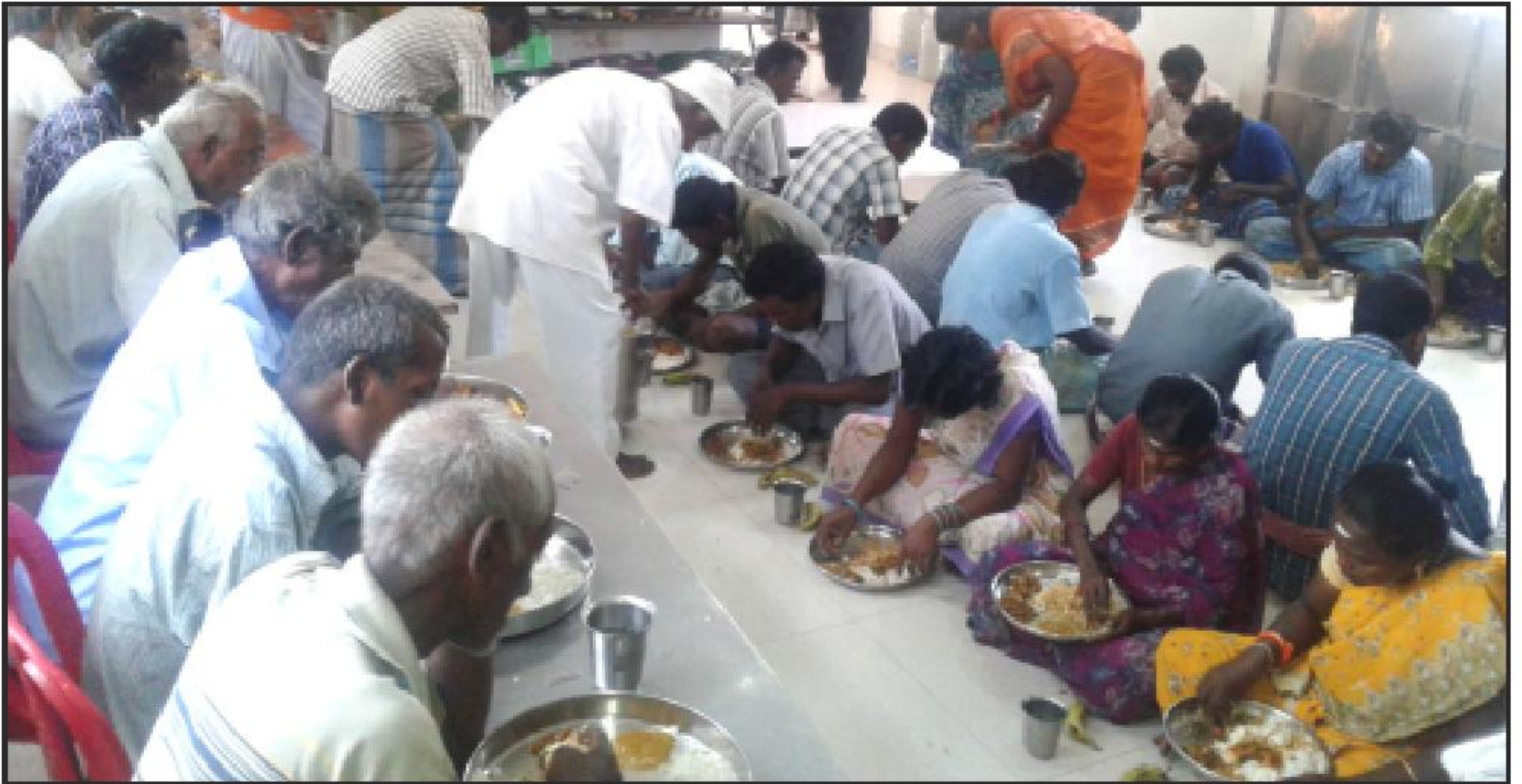
சென்னை வேளச்சேரி நித்ய தீப தருமச் சாலையில் தினசரி நூற்றுக்கணக்கானோர் பசியாறும் அற்புதக்காட்சி.