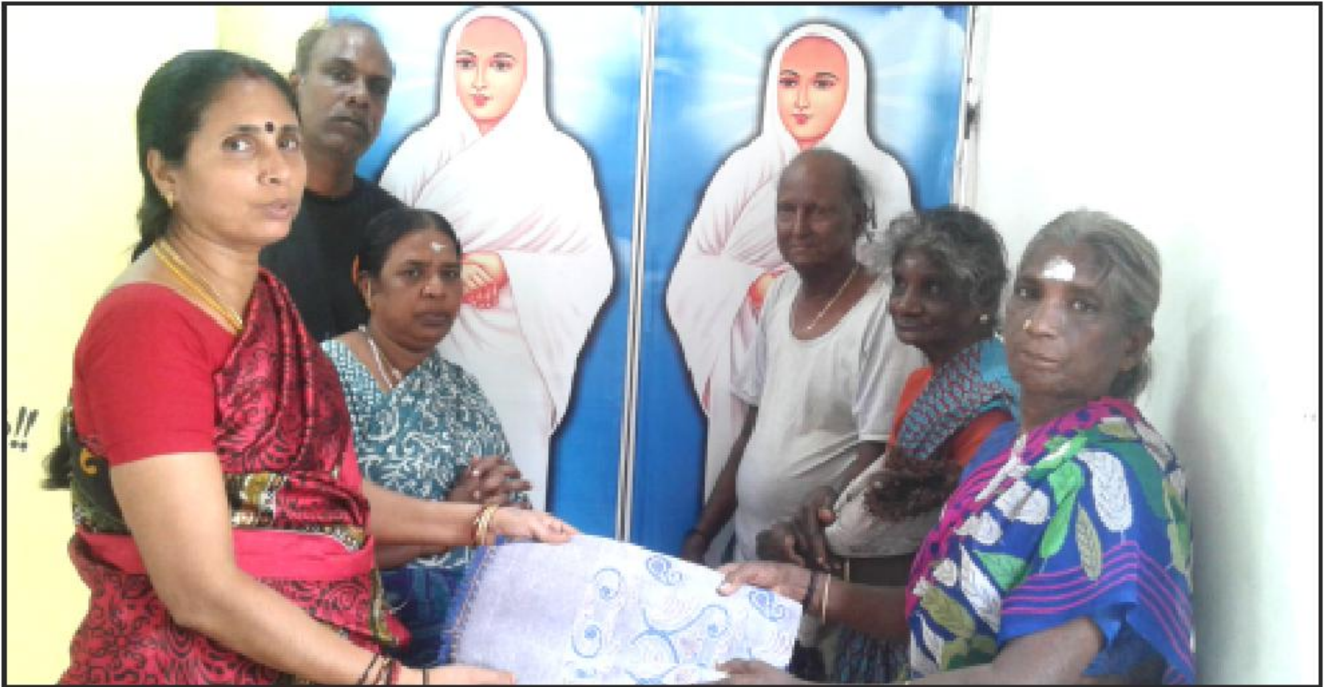
தீபம் அறக்கட்டளையின் ஆன்மநேய அறப்பணிகளில் ஒன்றான வறியவர்களுக்கு குளிருக்கு இதமான போர்வை அளிக்கப்படும் காட்சி.