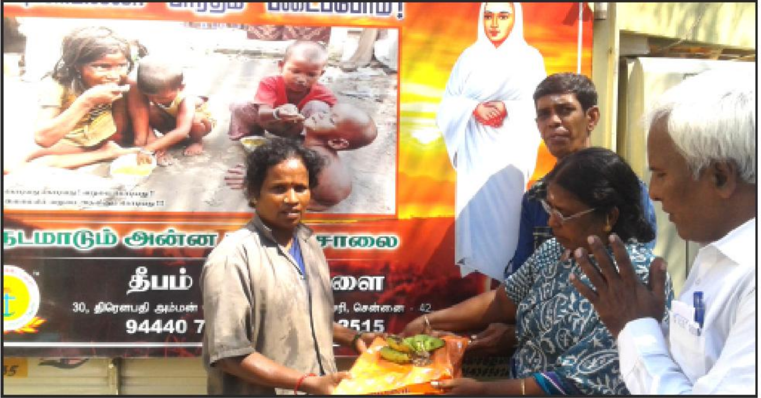
நித்ய தீப தருமச் சாலையில் தூப்பரவு பணி செய்யும் பெண் ஒருவருக்கு புத்தாடை வாழங்கி மகிழ்விக்கும் தயவு. மின்னல் அம்மா.