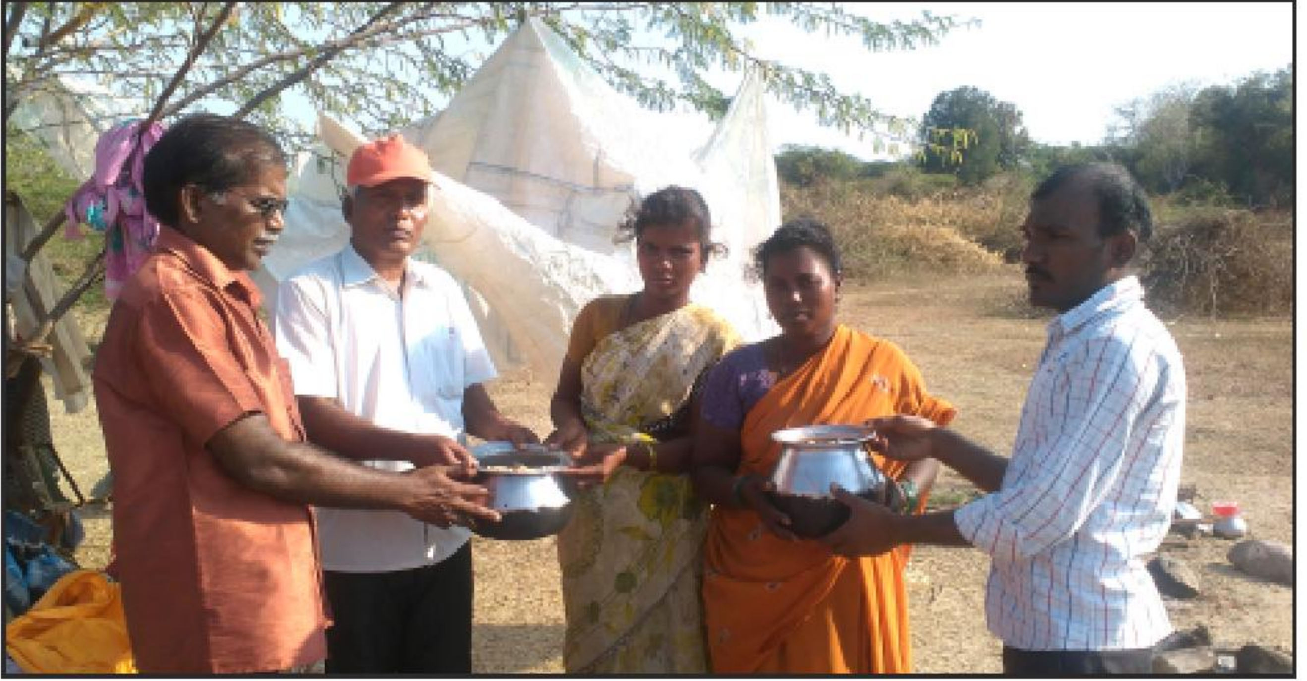
வேலூர் மாவட்டம் சோளிங்கர் அருகே நந்திமங்களம் இராமாபுரம் கிராமத்தில் பசியாற்றுவிக்கும் சேவையில் தீபத்தின் நிர்வாகிகள்.