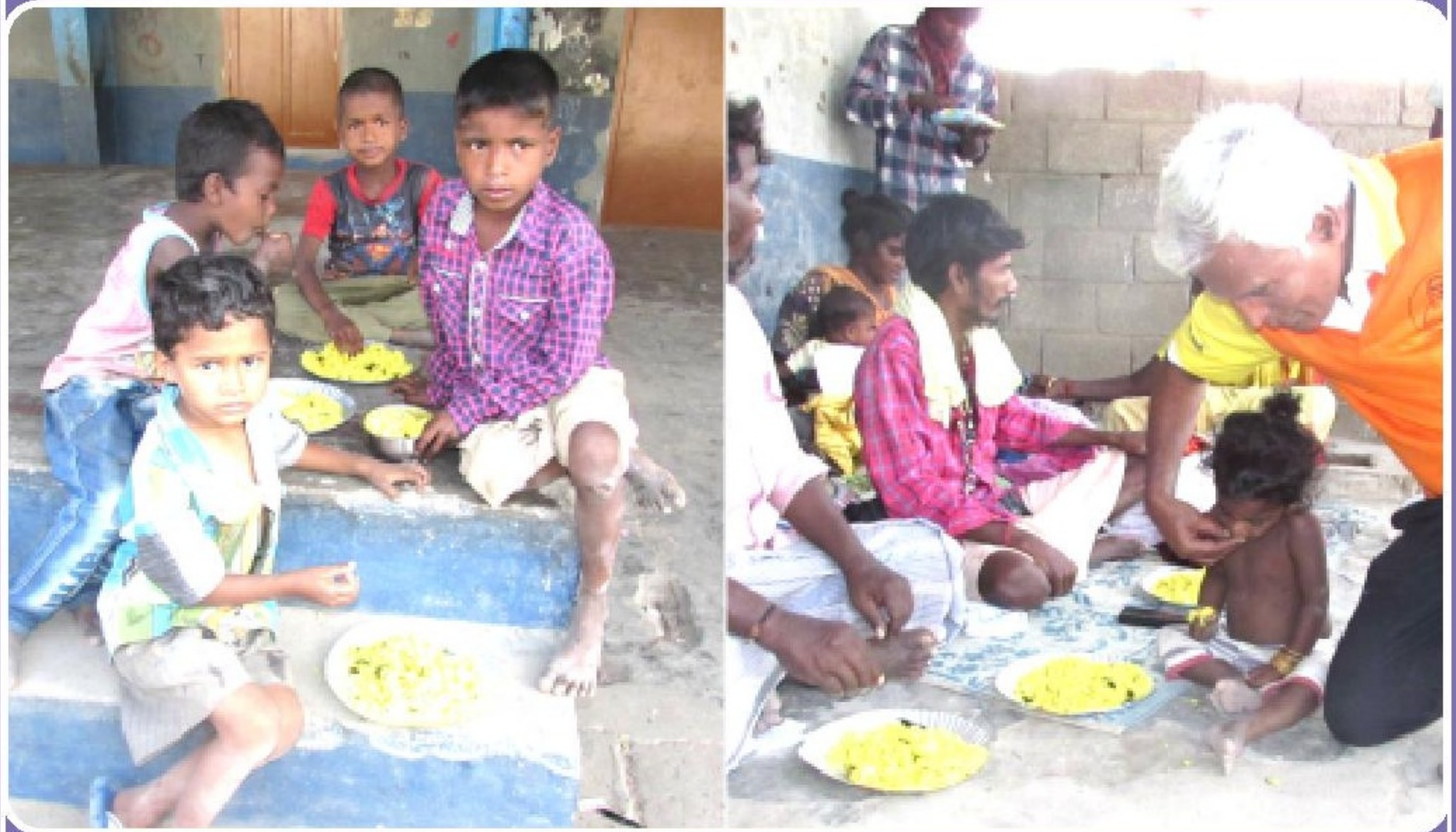
நடமாடும் நீதியை தீப தகும சாலை முமாக அறுகவை உணவு வகைகளை பசியாற்றி பாலமணி மாறாத பசினி பிஞ்சுக் குழந்தைகள்.