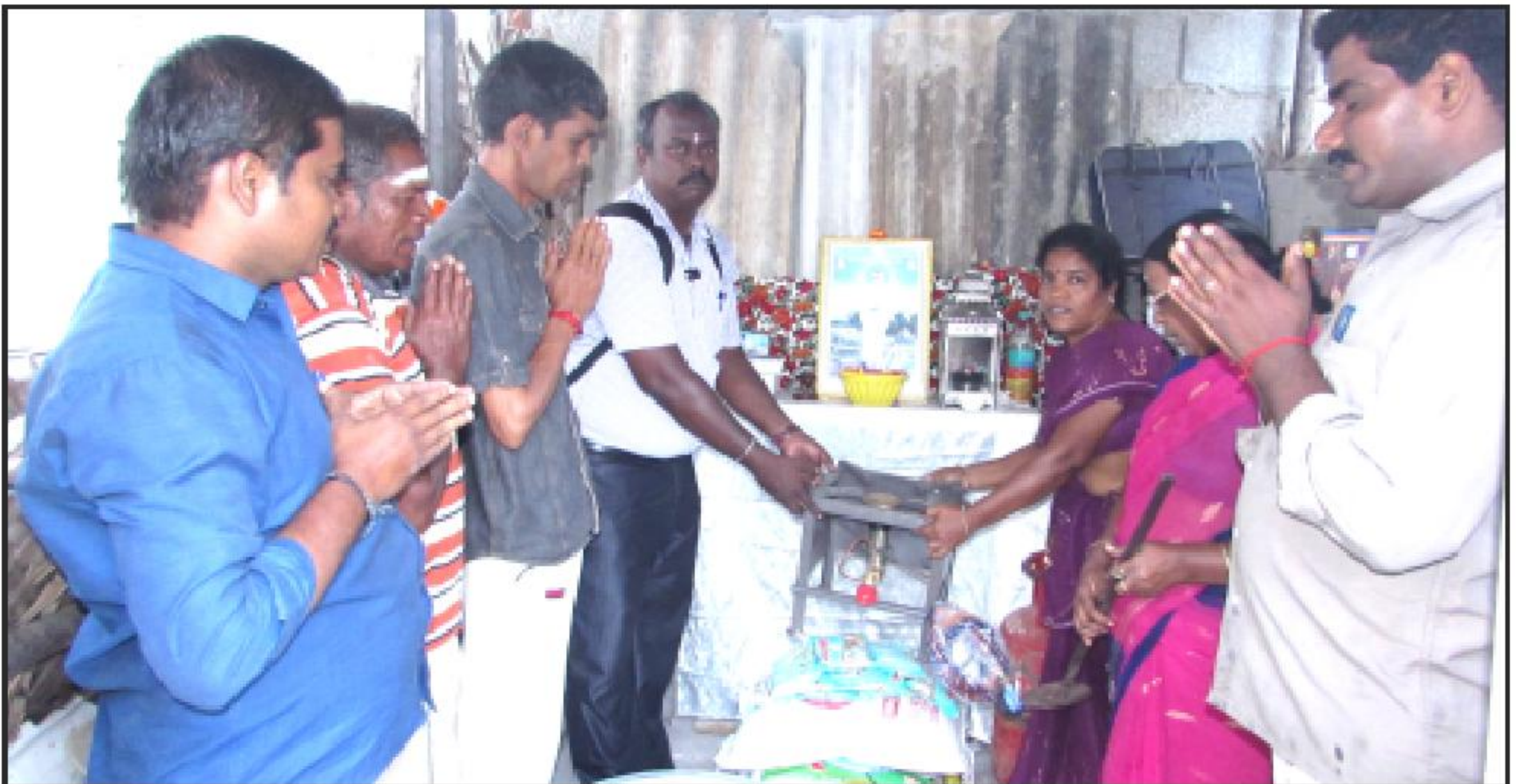
சென்னை வேளச்சேரி, கல்குட்டை தருமச்சாலைக்கு கஞ்சி வார்க்க சமையல் கேஸ் அடுப்பு மற்றும் பாத்திரங்கள் வாழங்குதல்.