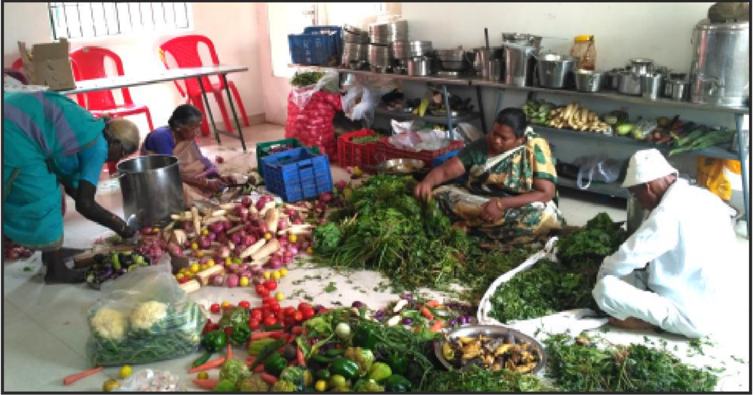
நித்ய தீப தருமச்சாலையில் தினசரி தயாராகும் அறுசுவை உணவிற்கு காய்கறிகளை நறுக்கும் தீபத்தின் தன்னார்வ தொண்டர்கள்.