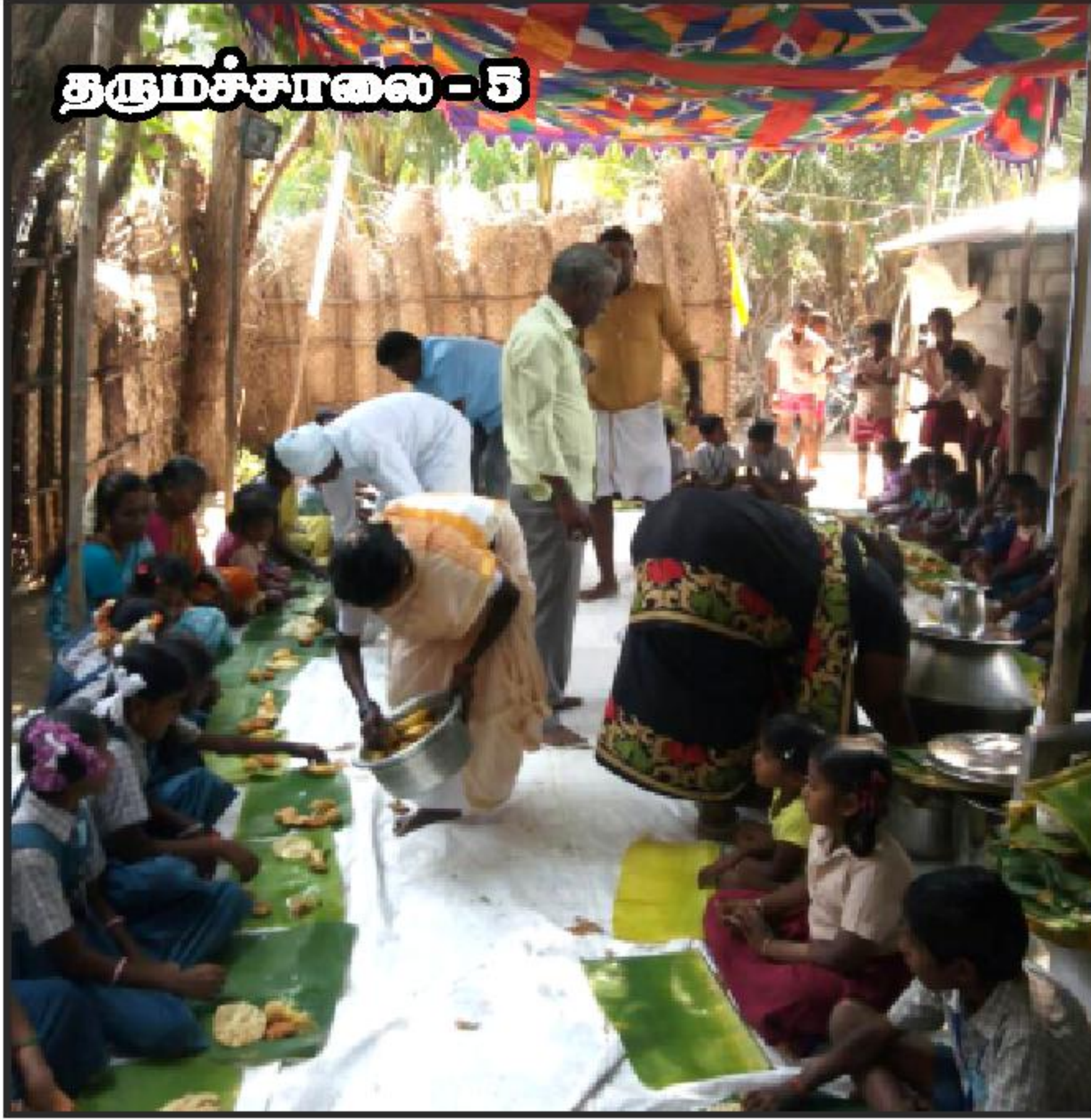
தருமச்சாலை - 5