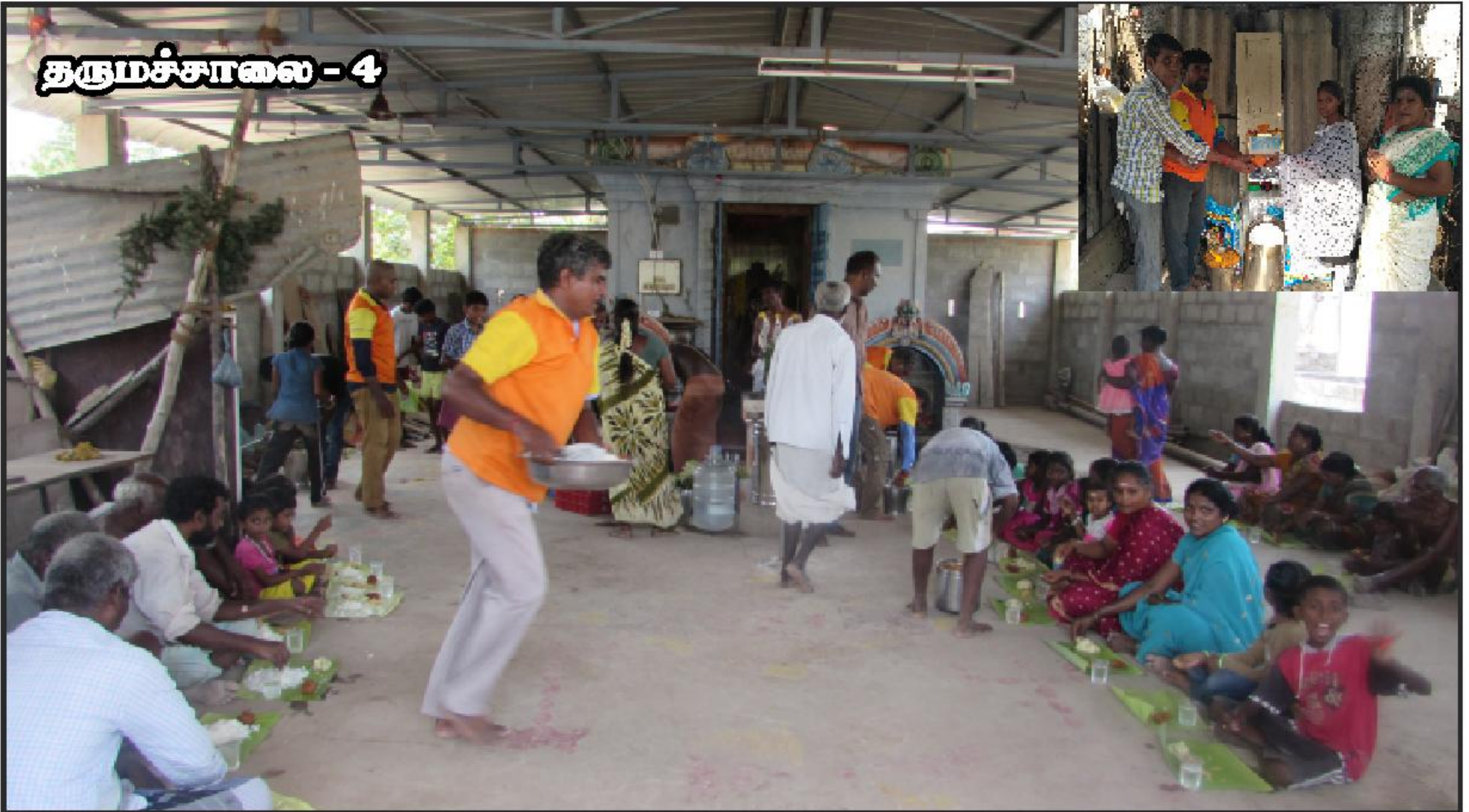
சென்னை வேளச்சேரி தீபம் அறக்கட்டளையின் சார்பில் கல்குட்டை தருமச்சாலை பசியாற்றுவிக்கப்படும் அற்புதக்காட்சி.