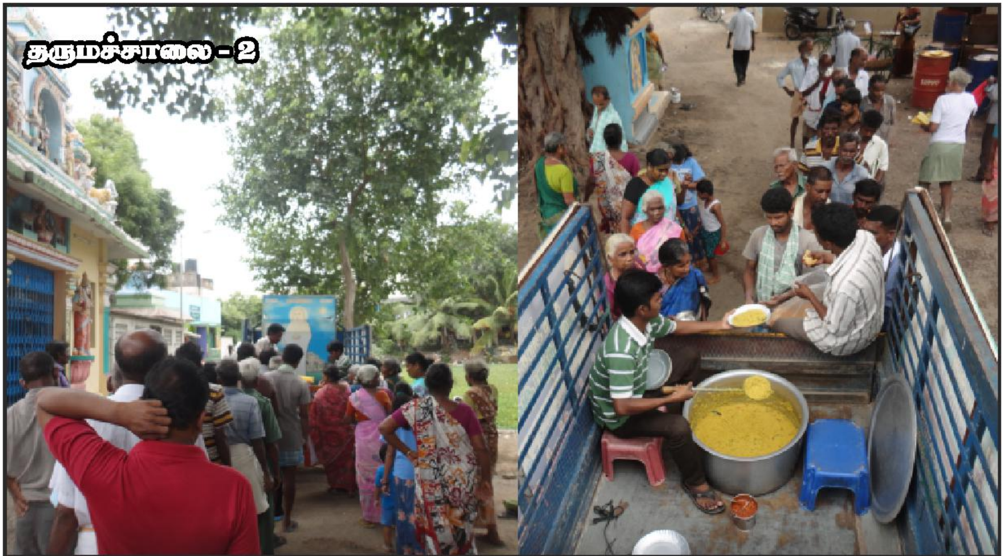
சென்னை வேளச்சேரி நடமாடும் நித்ய அன்ன தருமச்சாலை மூலம் தினசரி நூற்றுக்கணக்கானோர்களுக்கு பசியாற்றுவிக்கப்படும் அற்புத காட்சி.