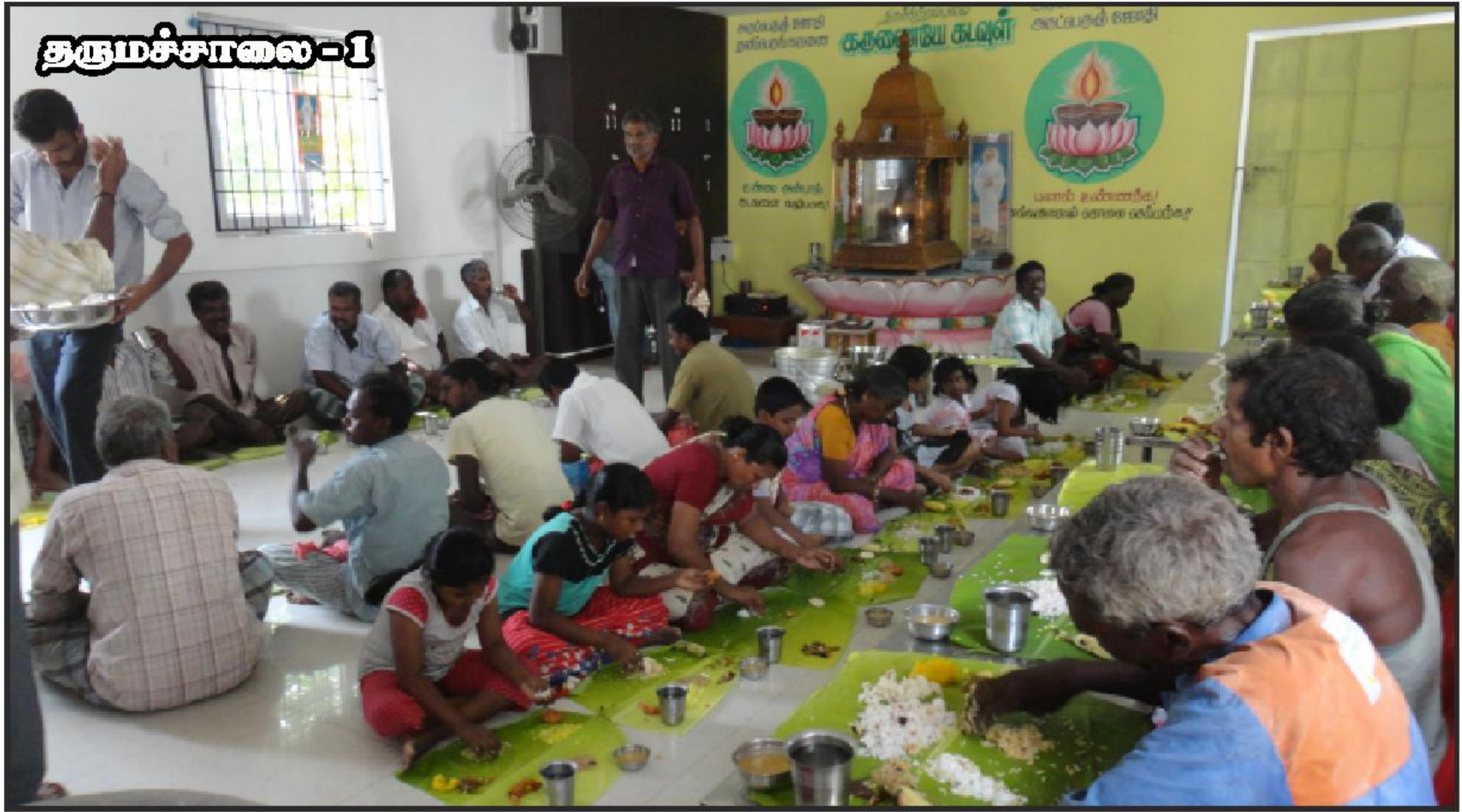
தலைமையகம் : சென்னை வேளச்சேரி நித்ய தீப தருமச்சாலையில் தினசரி நூற்றுக்கணக்கானோர்களுக்கு பசியாற்றுவிக்கப்படும் அற்புத காட்சி.

பஞ்சம் என்பதே இல்லா நிலையை மாரதம் வற வேண்டும்.