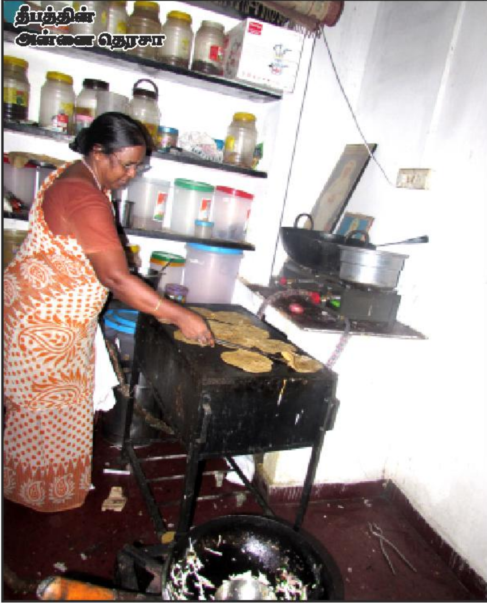
தீபத்தின் அன்னை தெரசா