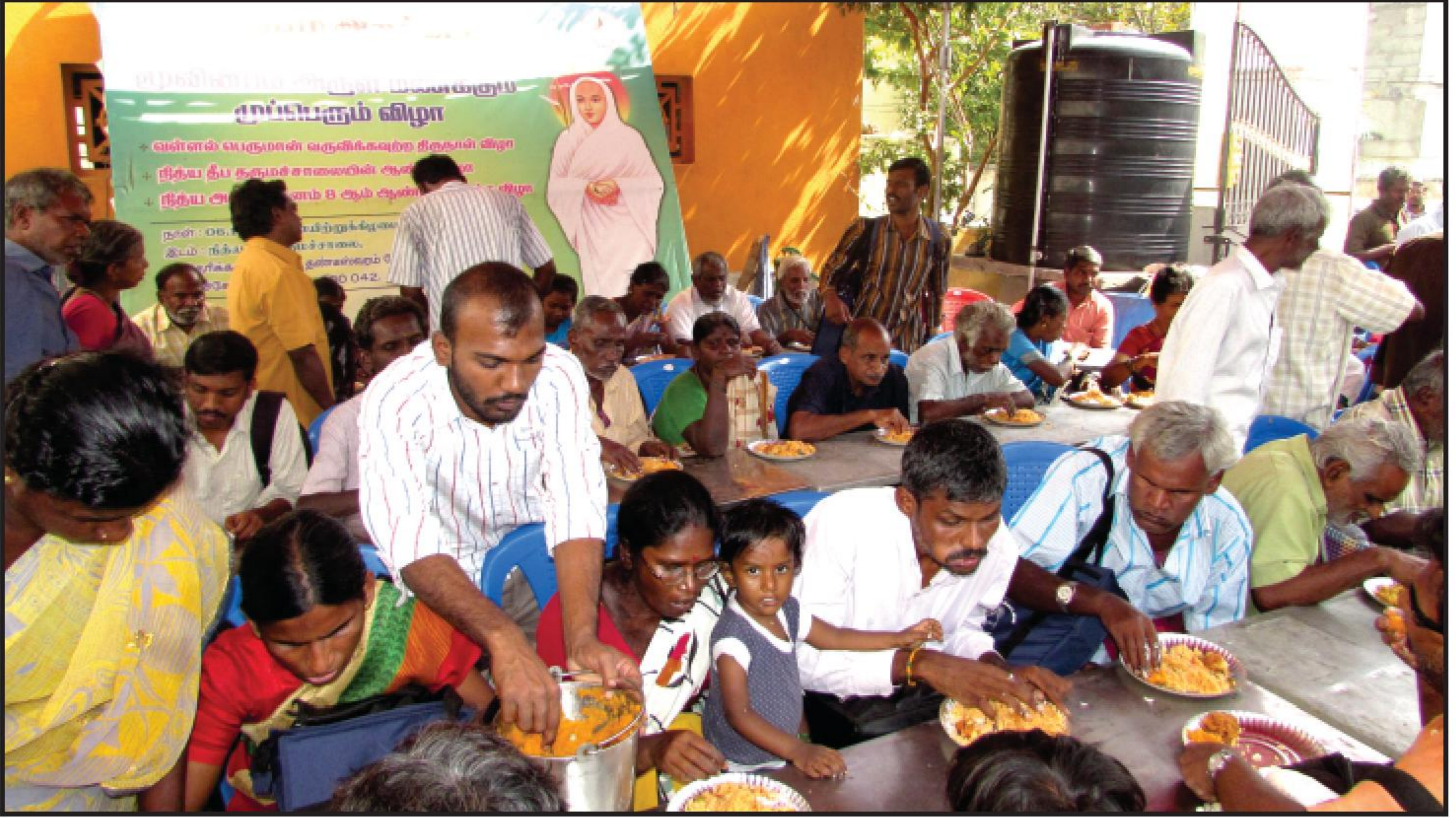
நூற்றுக்கணக்கான பார்வையற்றவர்களுக்கு நித்ய தீப தருமச்சாலையில் அன்போடு அன்னமளித்தல்...