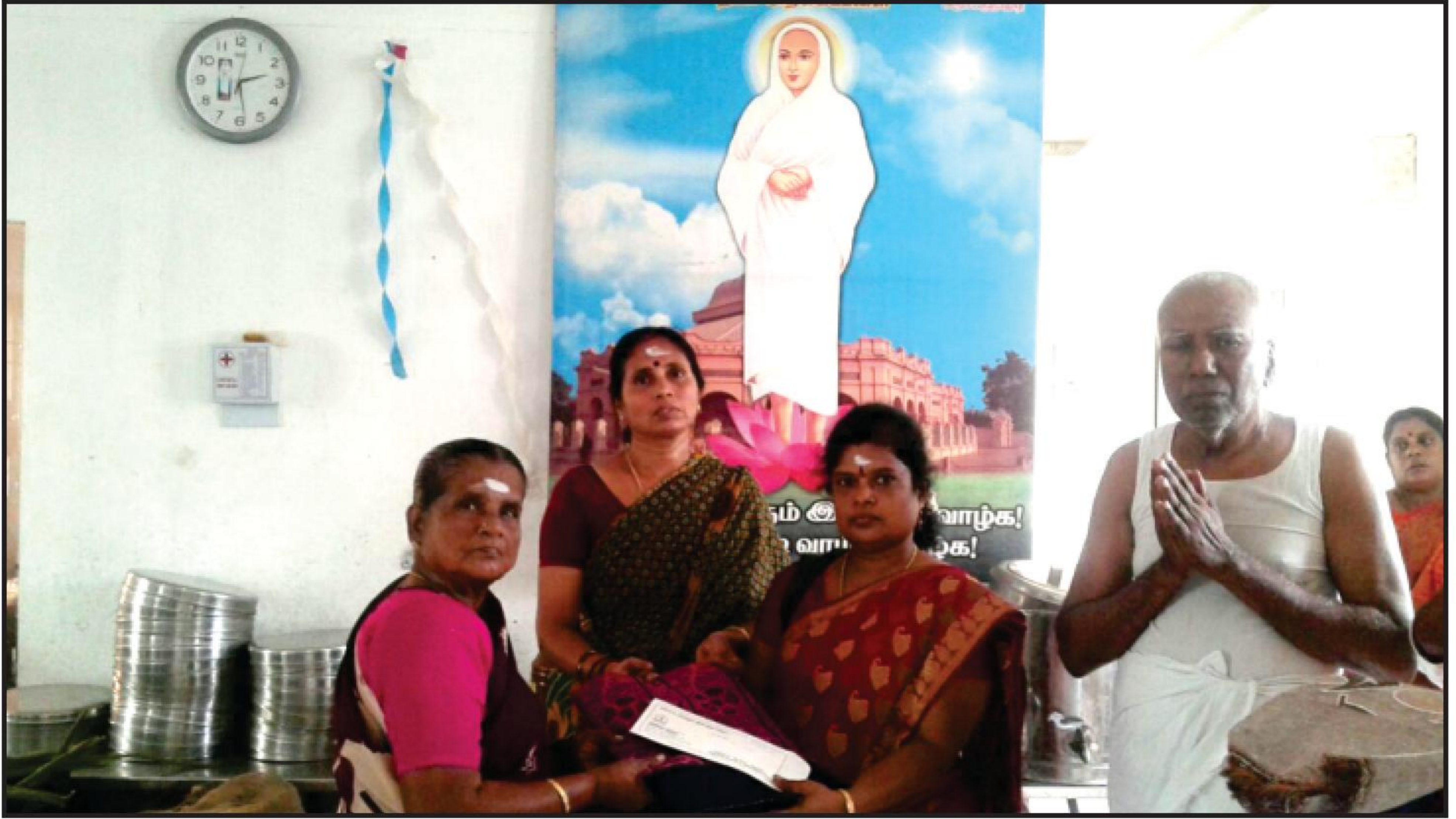
தீபம் அறக்கட்டளைக்கு சமுதாயம் பணியே உயிர்மூச்சு