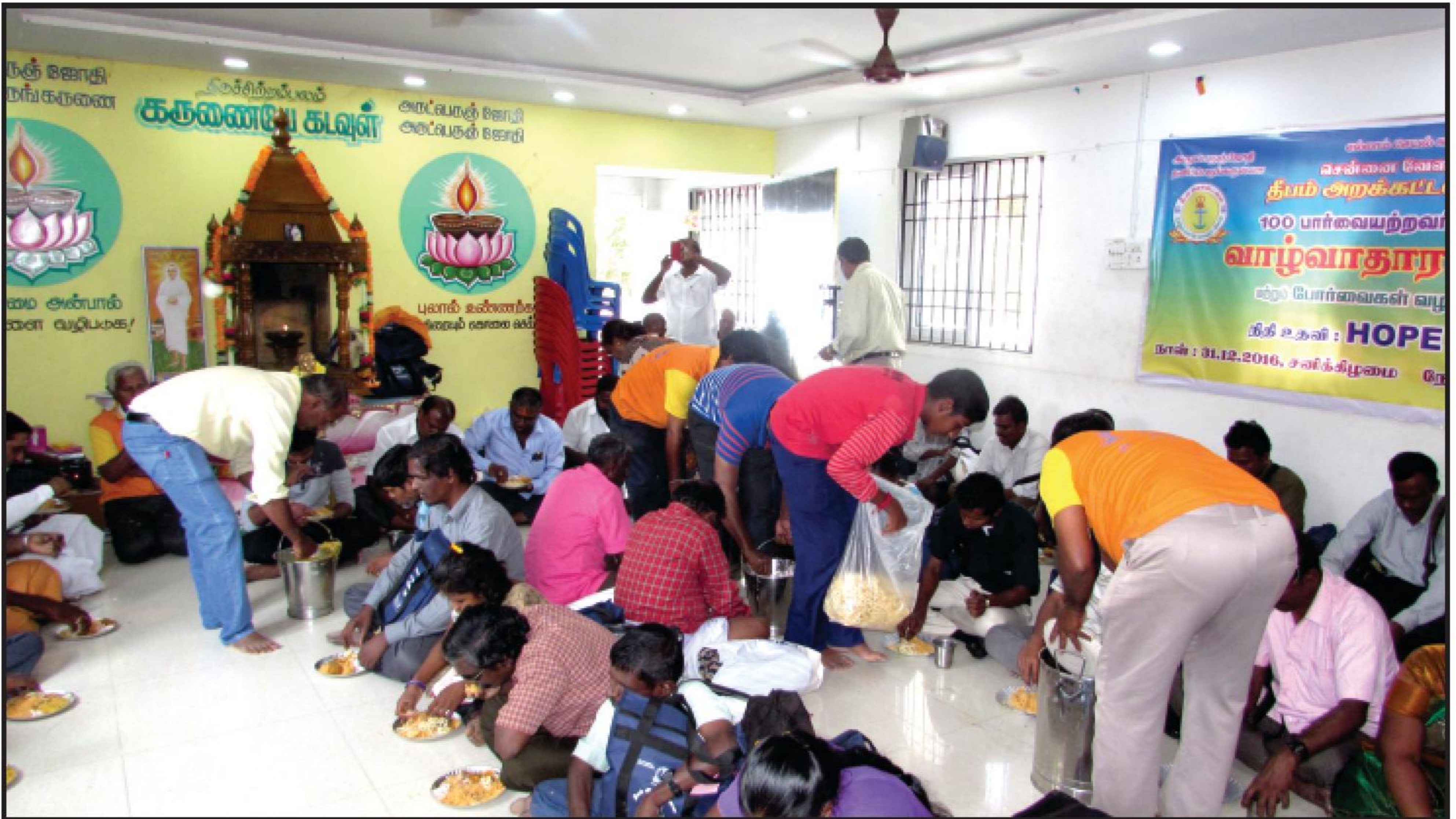
பார்வையற்ற 115 குடும்பங்களுக்கு 1.50 லட்சம் வாழ்வாதார உதவி தந்து பசிற்றுவித்தல் செய்யும் காட்சி