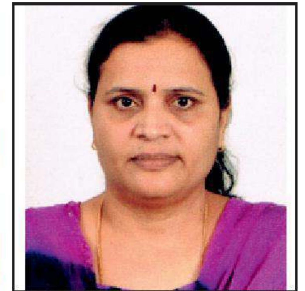
P. ஜோதீஸ்வரி து. செயலாளர் (கல்வி)