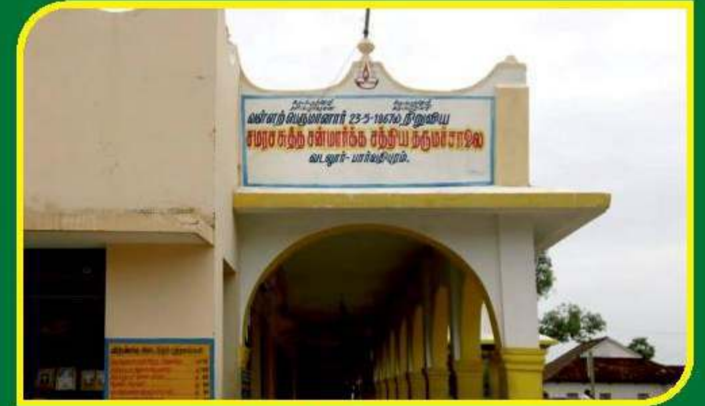
வடலூர் சத்திய தருமச்சாலை