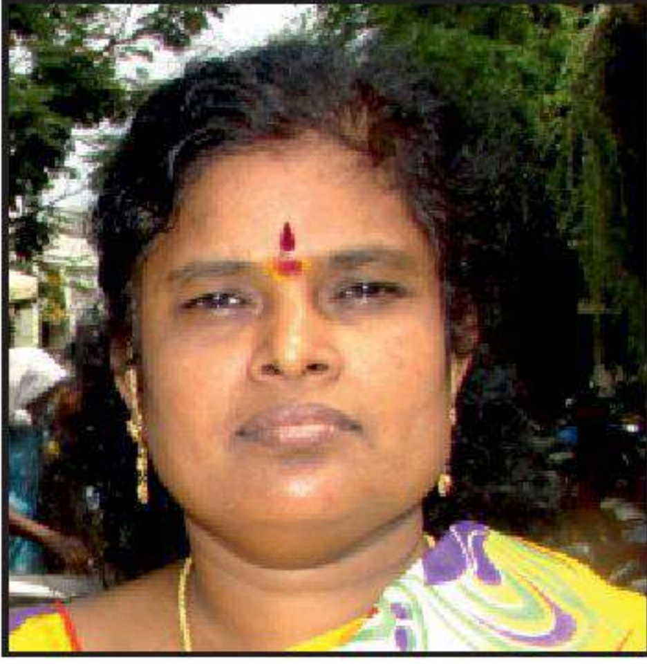
J. ஜானகி து. செயலாளர் (கல்வி)