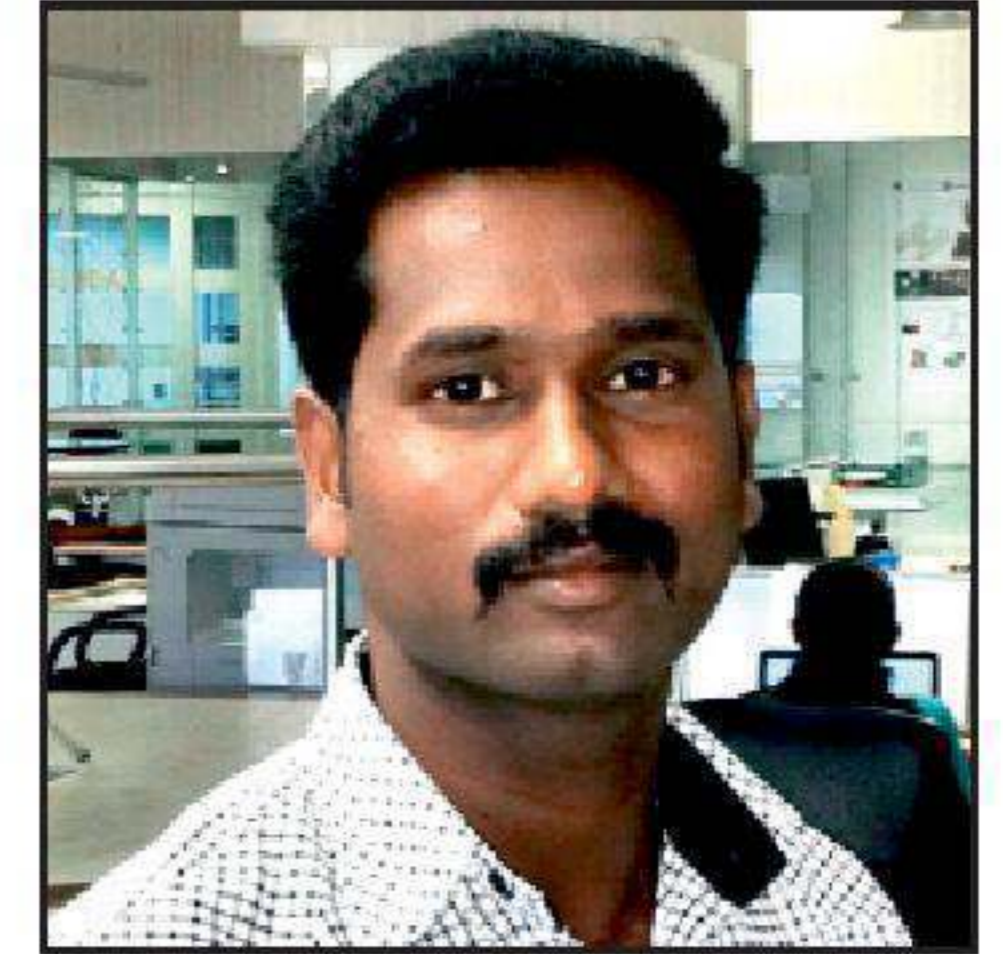
D. ஆனந்த் பொருளாளர்