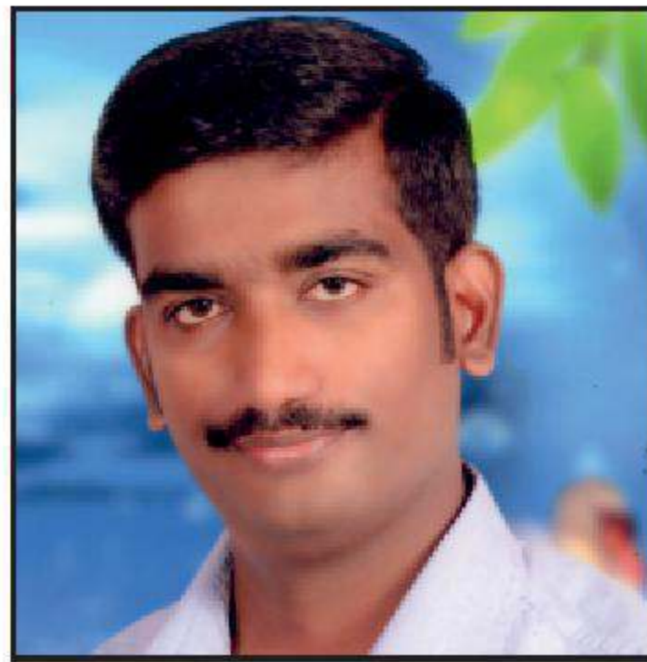
P. ஆனந்த் து. செயலாளர் (வெளியுறவு)