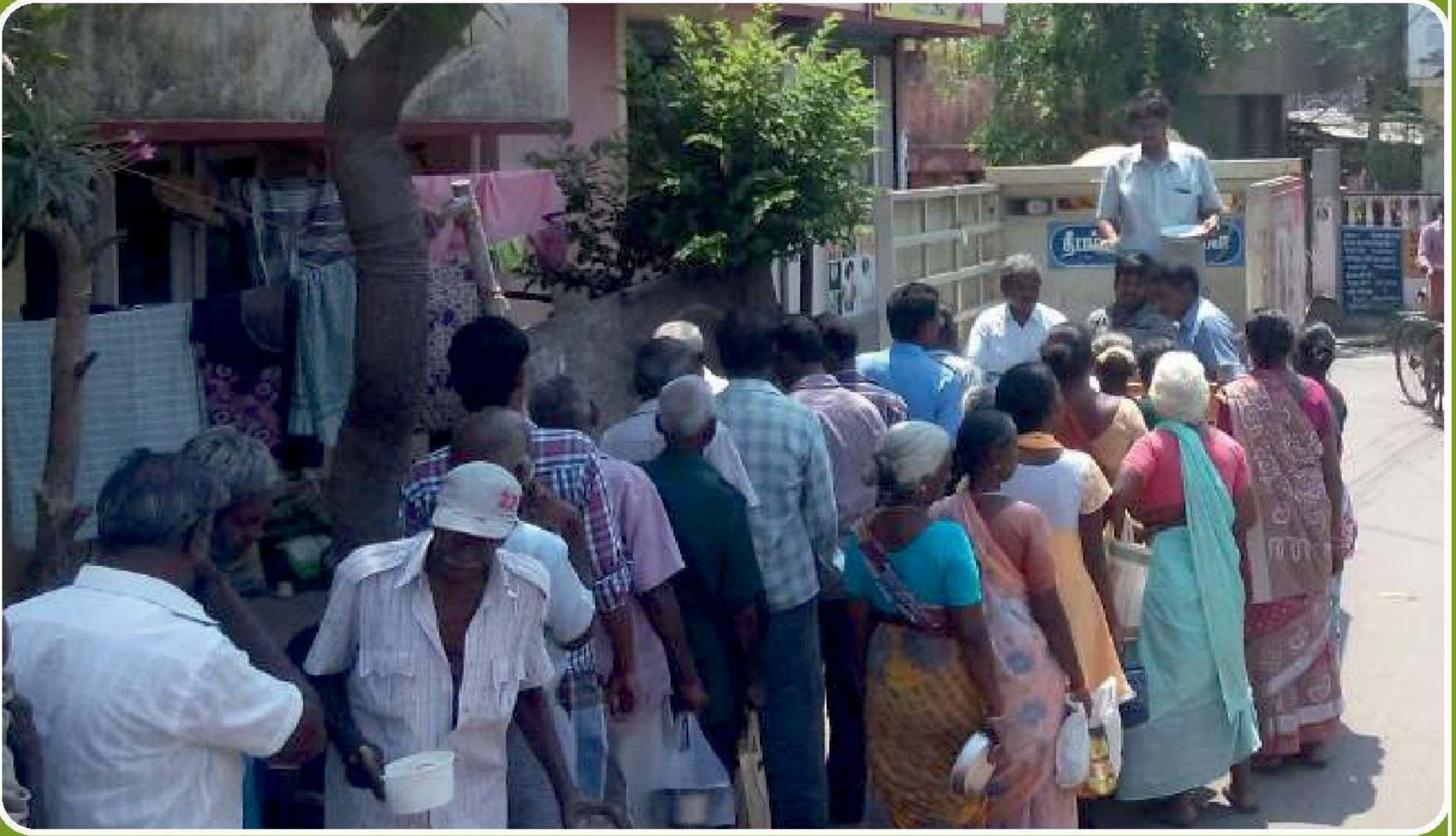
சென்னை வேளச்சேரியில் நாள்தோறும் தீபம் அறக்கட்டளையின் சார்பாக நடமாடும் நீதிய அனை தருமச்சாலையின் மூலம் பசியாற்றுவிக்கப்படும் அற்புதக்காட்சி