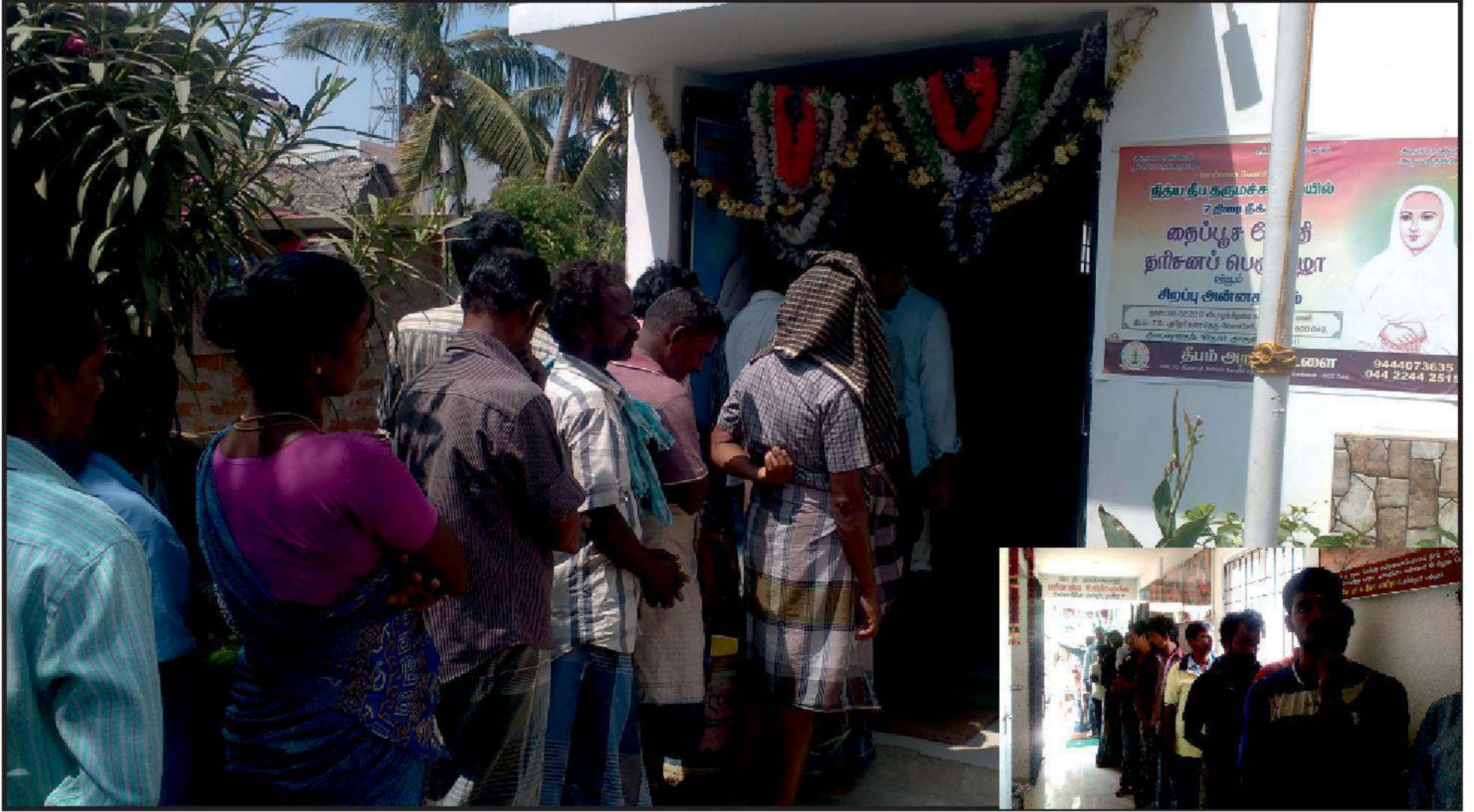
சென்னை வேளச்சேரி நித்ய தீப தருமச் சாலையில் பசியாற தினந்தோறும் நீண்ட வரிசையில் காத்திருக்கும் அன்பர்கள்.