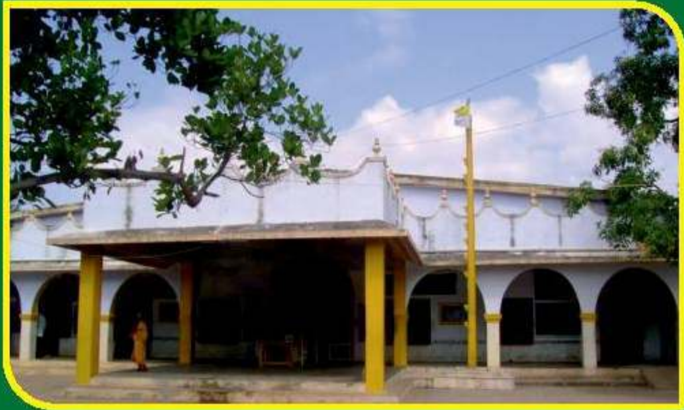
சத்திய தருமச்சாலையின் முகப்பு தோற்றம்