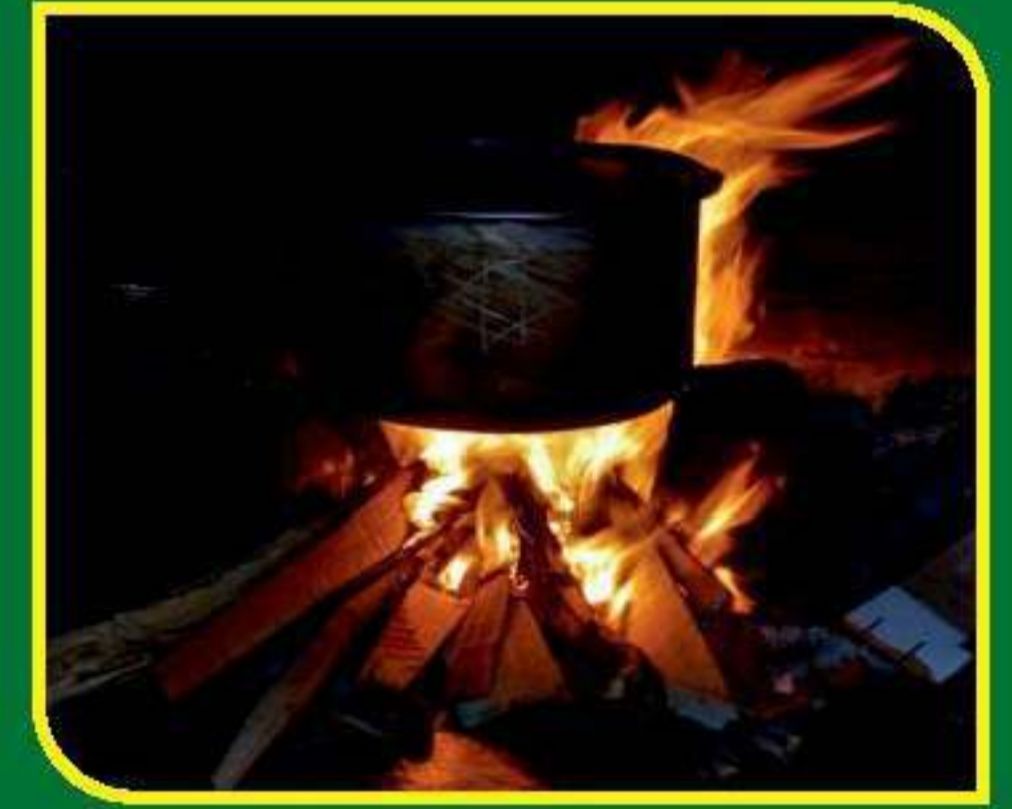
அணையா அடுப்பில் அருள் உணவு