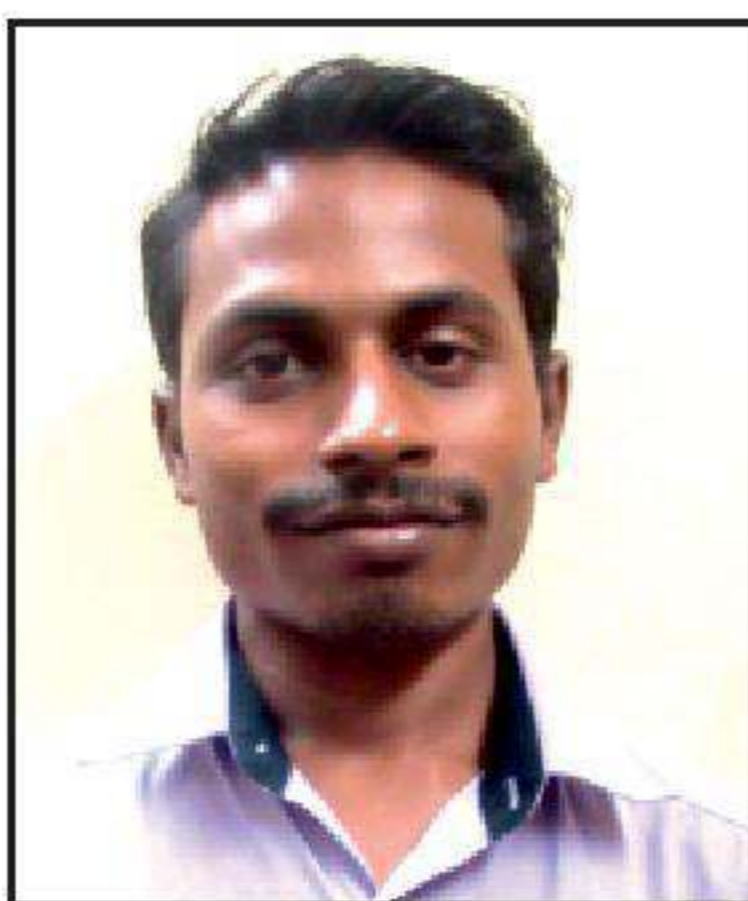
J. கன்னிரான் உறுப்பினர்