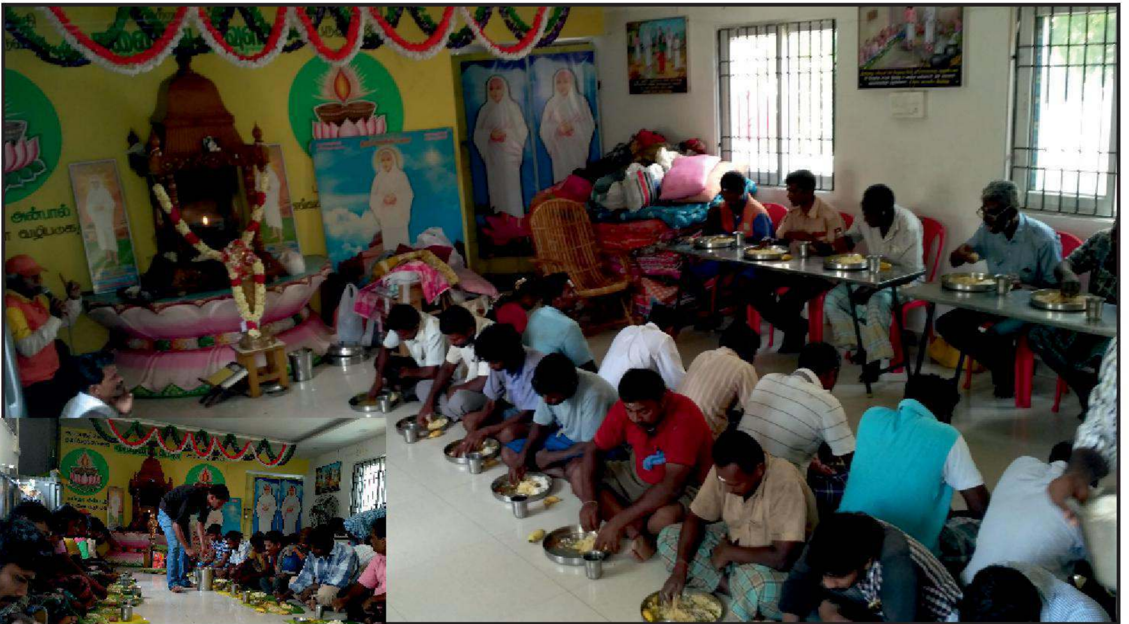
சென்னை வேளச்சேரி நித்ய தீப தருமச் சாலையில் தினந்தோறும் பல நூற்றுக்கணக்கான அன்பர்களுக்கு பசியாற்றுவிக்கும் காட்சி