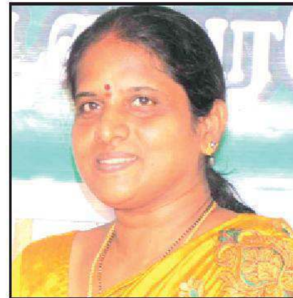
B. புஷ்பா து. செயலாளர் (கல்வி)