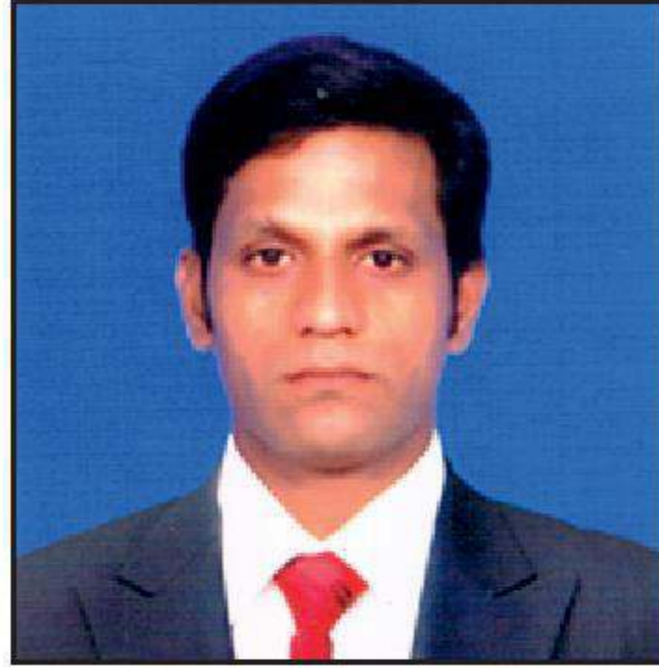
S. கணபதி து. செயலாளர் (மருத்துவம்)