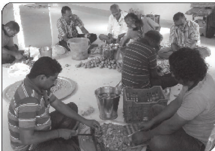
நித்ய தீப தருமச்சாலையில் அன்னதானப்பணியில் அருளாளர்கள்