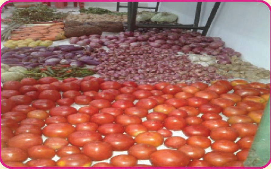
நித்ய அன்னதானத்திற்கு தினமும் காய்கறிகளை அள்ளித்தரும் வேளச்சேரி பெரியாண்டவர் சூப்பர் மார்்கெட்