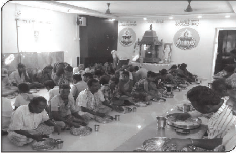
நித்ய அன்னதானம் 7 ஆண்டுகளாக சென்னை வேளச்சேரி நித்ய தீப தருமச் சாலையில் பசியாற்றுவித்தல்