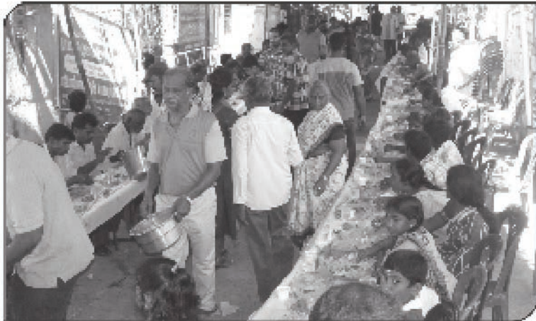
ஆண்டுவிழா பசியாற்றுவித்தவின் ஒரு பகுதி - நாள் : 10.04.2016

பணிந்தவனுக்கு தோல்வி பாராயில்லை... துணிந்தவனுக்கு வெற்றி தூராயில்லை!