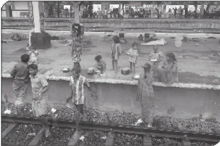
நடமாடும் தர்மச்சாலையின் மூலம் பல்லாவரம் பகுதியில் பசித்த குழந்தைகளுக்கு தேடிச்சென்று அன்னமிடல்