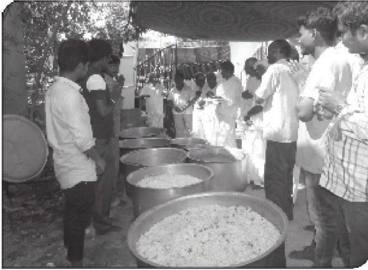
5000 பேருக்கு பசியாற்றுவித்தலுக்கான அன்னமும்... பிரார்த்தனையும்...