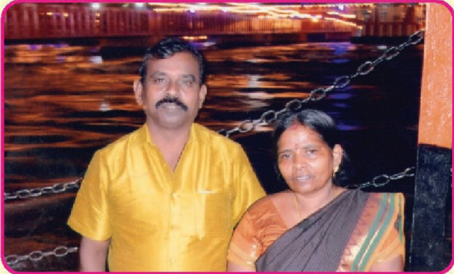
நித்ய அன்வதானத்திற்கு 6 மாதங்களாக, தினமும் வாய்கறிகளை அன்வித்தமும் அருவானார் தயவநித்ய. C. அந்தோனிராஜ் - பூங்கொடி குடும்பத்தை தீயம் மனதாய் வாழ்த்துகிறது